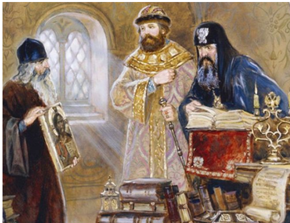
Царь Алексей Михайлович и Патриарх Никон осматривают древние иконы и церковные книги

При царевне Софье в специальном законе определялись жесткие меры наказания для старообрядцев: от лишения имущества и ссылки до смертной казни