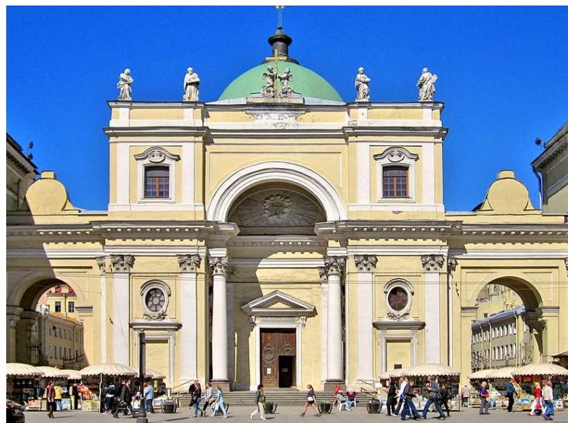
Католическая церковь Святой Екатерины в Санкт – Петербурге на Невском проспекте

Модернизация (необходимость приглашения иностранных специалистов), расширение территории страны и укрепление связей с другими государствами, способствовали более терпимому отношению к другим конфессиям