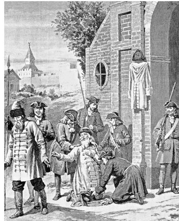
Обрезание русских кафтанов при Петре I