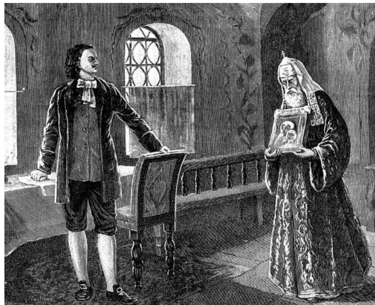
Петр I и патриарх Адриан

Каковы были взаимоотношения государства и Русской Православной Церкви в эпоху Петра I? Каковы суть и итоги церковной реформы Петра? Стремился ли Петр I поставить духовенство на службу Отечеству?