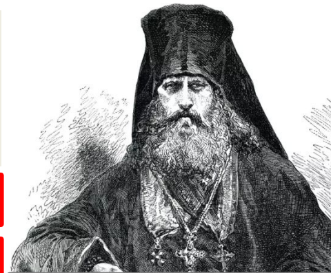
Феофан Прокопович, автор «Духовного регламента»

В 1700 г. патриарх Адриан умер. Пётр I запретил выбирать нового главу церкви и учредил должность местоблюстителя патриаршего престола . При решении важных вопросов местоблюститель был обязан советоваться с епископами. Их решение утверждал царь