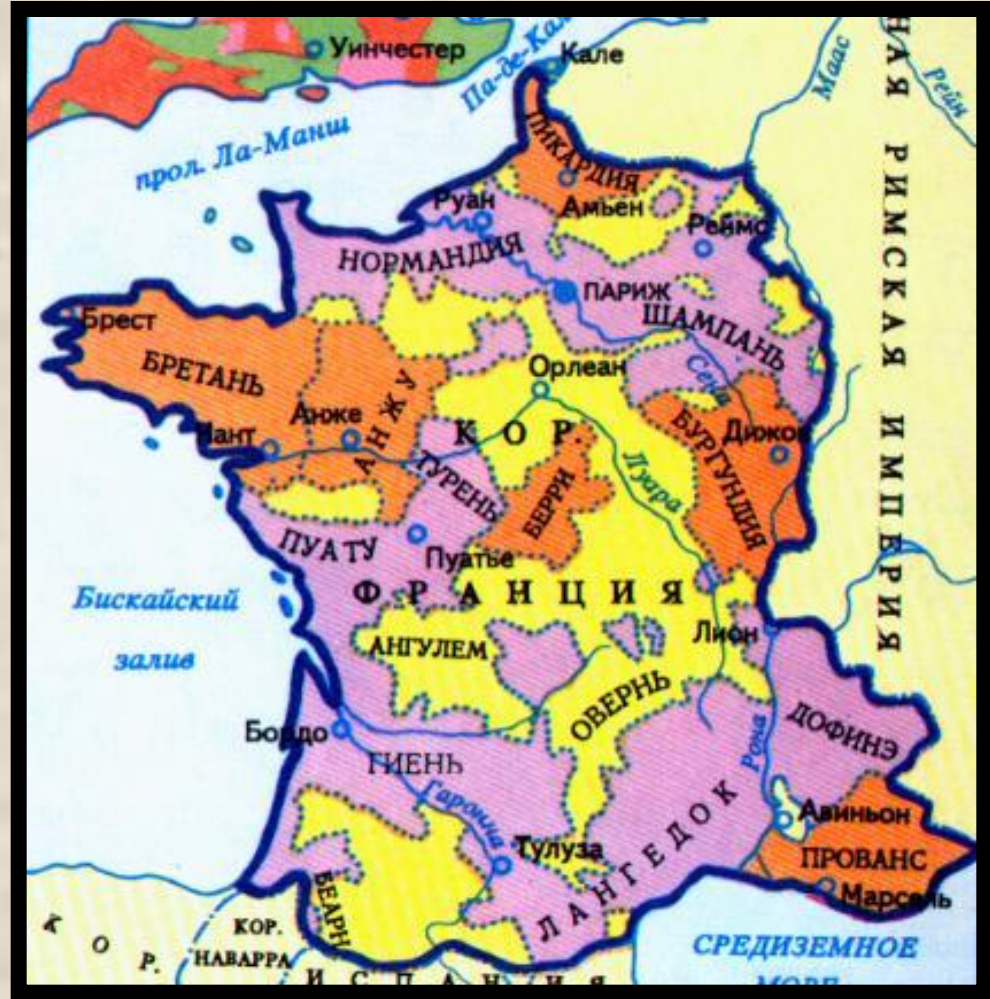
Франция в конце XV в.