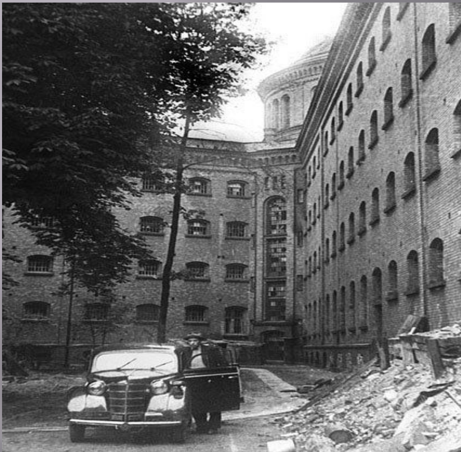
Знаменитая немецкая тюрьма Моабит. Занята советскими войсками 29.04.1945

Войска 1-го Белорусского фронта продолжали бои на улицах Берлина. Немецкие войска, зажатые в центральных районах германской столицы, оказывают отчаянное сопротивление. Советские части вчера прорвались по северному берегу реки Шпрее в городской район Моабит. Очищая на своём пути кварталы, прилегающие к улице Альт Моабит, наши бойцы вышли к известной Моабитской тюрьме и штурмом овладели ею. Отряды противника пытались удержать позиции у Лертерской товарной станции и на территории фотохимического завода. Сильными ударами гитлеровцы были прижаты к Шпрее и уничтожены