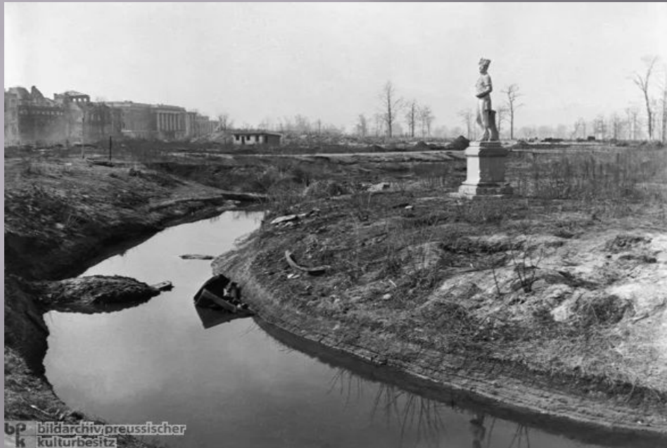
Парк Тиргартен занятый советскими войсками 1.05.1945

В Берлине войска фронта вели ожесточённые уличные бои. Советские части подавили узлы сопротивления противника на улице Бисмаркштрассе и подошли к парку Тиргартен с запада. Бои идут за каждую улицу, квартал, отдельные дома, квартиры и подвалы, в которых засели гитлеровцы. Наши штурмовые группы сегодня с боями заняли более ста кварталов в центре города. К исходу дня городские районы Шарлоттенбург и Шенеберг были полностью очищены от противника. За день боёв уничтожено свыше 8 тысяч немецких солдат и офицеров.