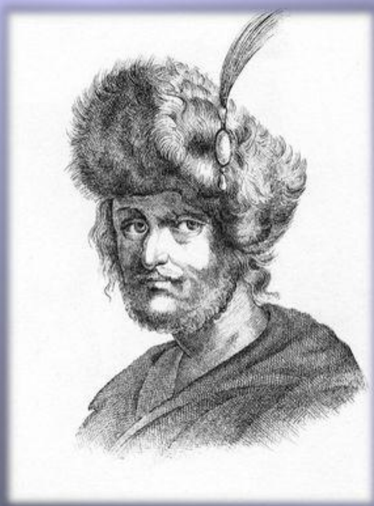
Лжедмитрий II (Тушинский вор) 1607 -1610