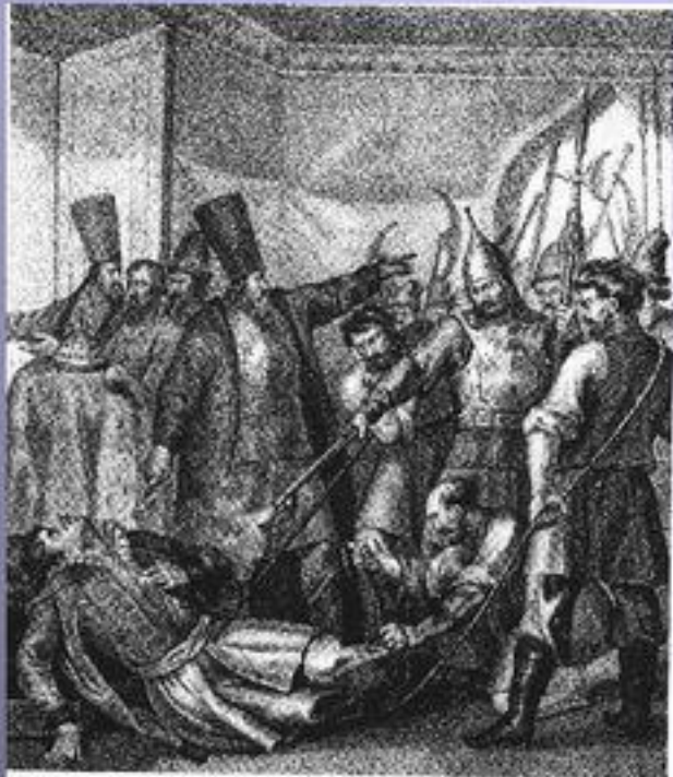
Семин-Теменин С.А. 1606 г.