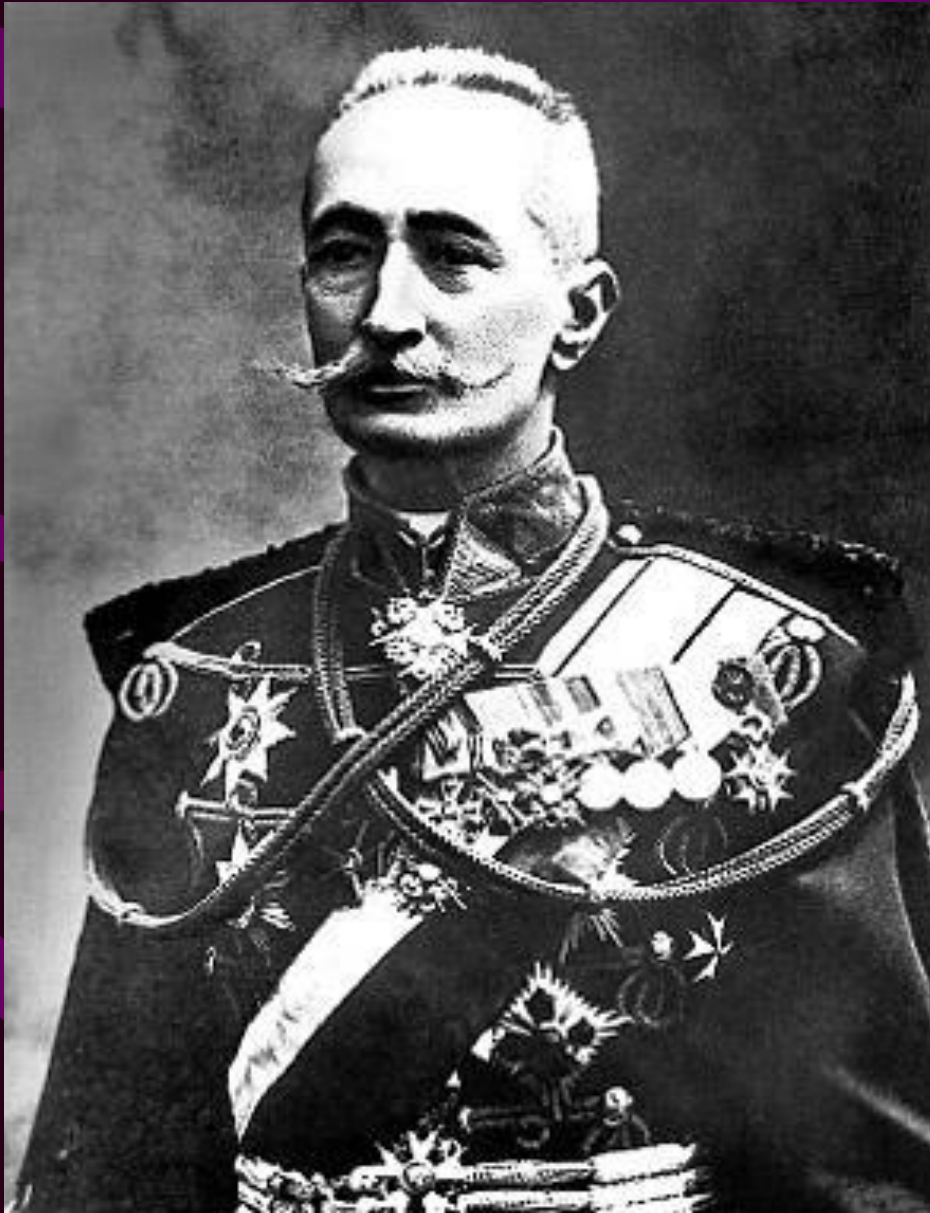
генерал А.А. Брусилов.