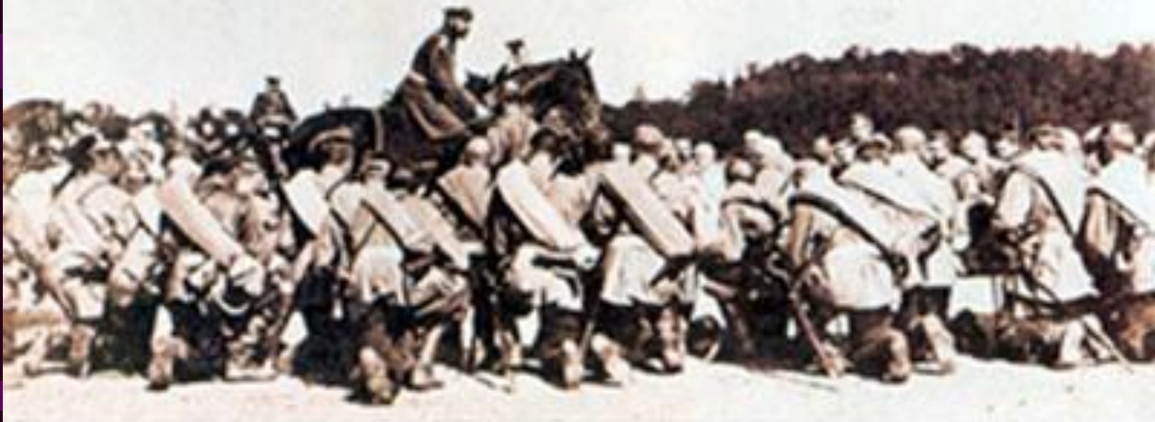
Царь Николай II благославляет русских солдат перед их отправкой на фронт. 1914 г.