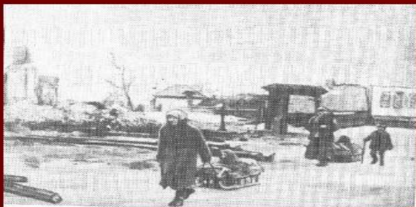
Жители, оставшиеся без крова

В конце лета 1942 г. был сожжен поселок Звезда, расстреляны около 40 человек.