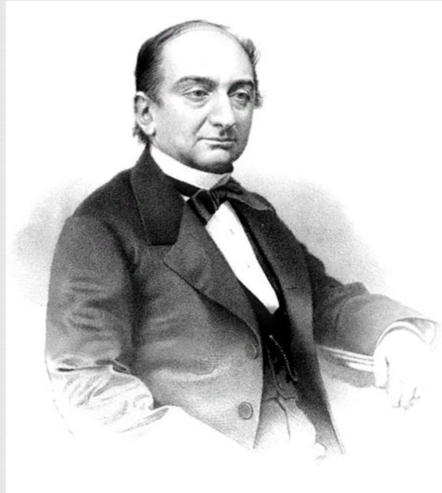
Делянов Иван Давыдович