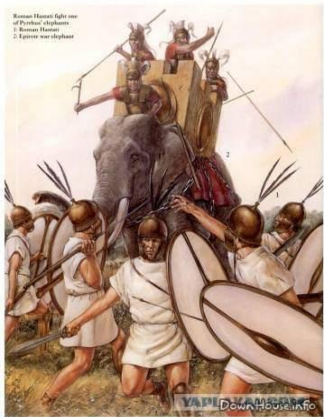
Roman Hastati fight one of Pyrrhus' elephants 1: Roman Hastati 2: Epirote war elephant

В 275 году до н.э. римлянам удалось одержать победу над армией Пирра, он навсегда покинул Аппенинский полуостров.