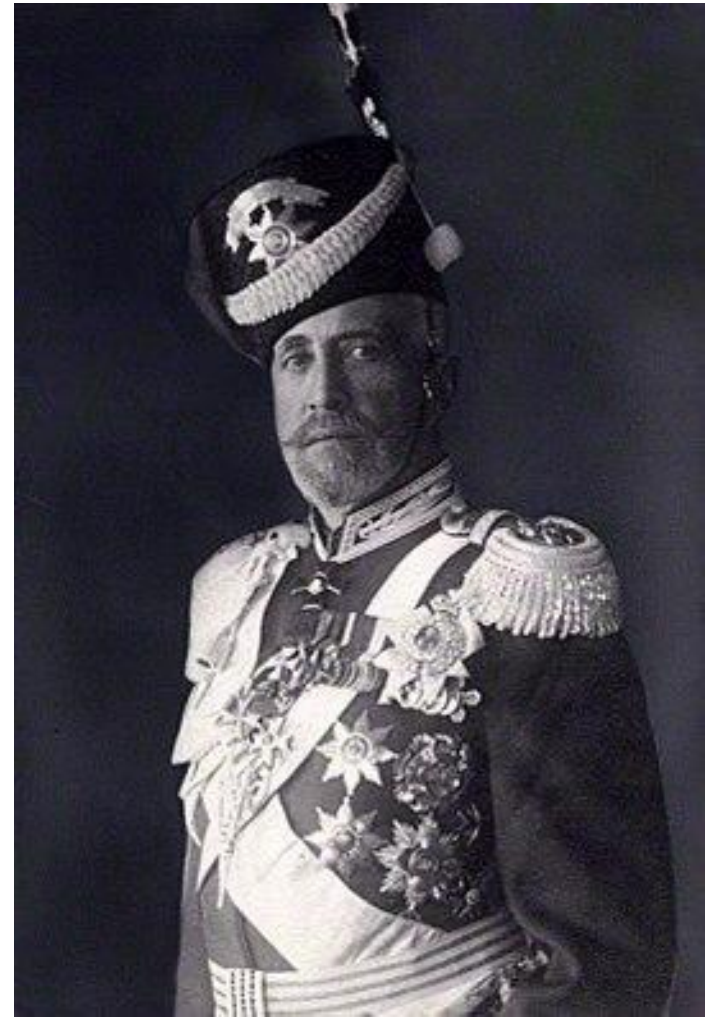
Николай Николаевич Романов

15 июня 1877 г. русские войска переправились через Дунай и развернули наступление . Быстро продвигались на юг, стремясь овладеть горными проходами через Балканы и выйти в Южную Болгарию. Важно было занять Шипкинский перевал. После двухдневных боев перевал был взят. Турки отступали.