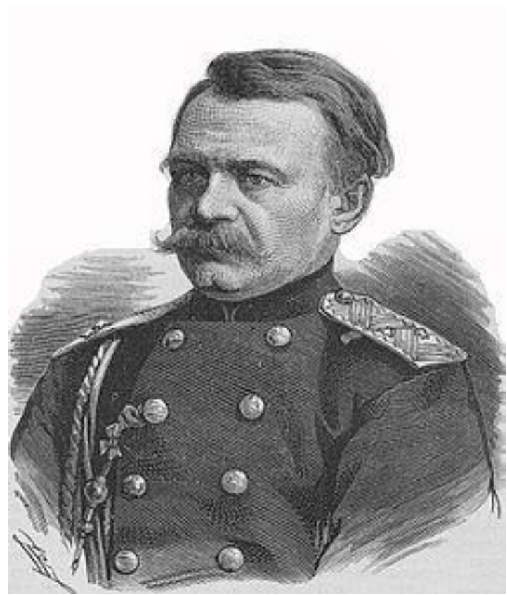
Столетов Николай Григорьевич (1831 – 1912)