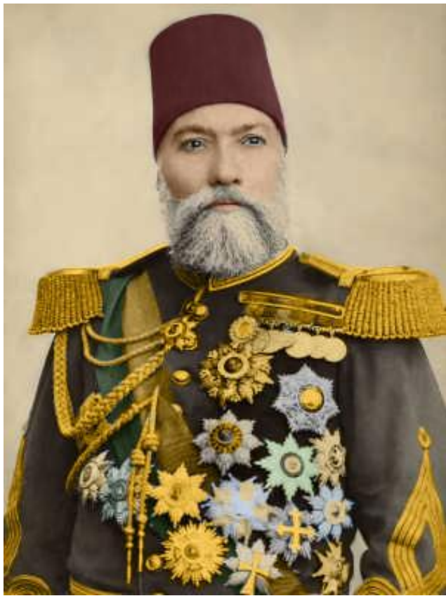
Осман Нури-паша (1832 – 1900)