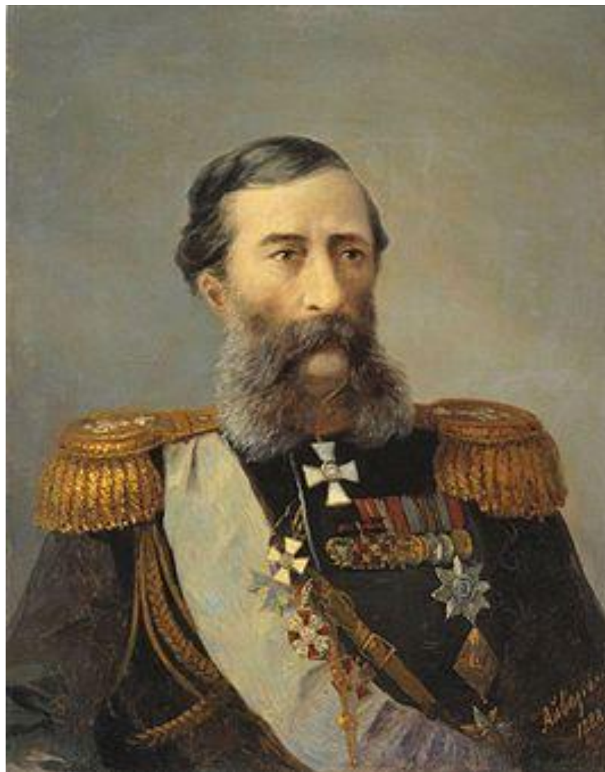
Граф Михаил Тариэлович Лорис-Меликов (1824 – 1888)