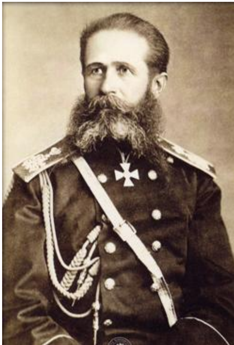
Иосиф Владимирович Гурко (1828 – 1901)