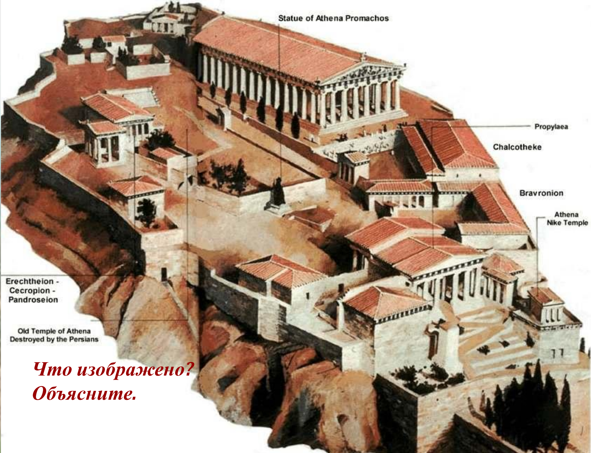
Statue of Athena Promachos