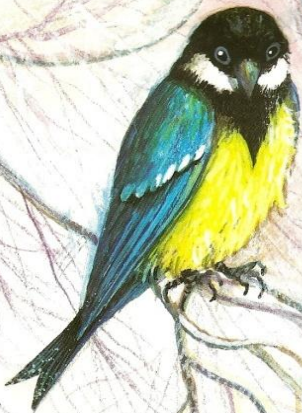
Рис. Е. ПОДКОЛЗИНА

Этот праздник олицетворяет пробуждение природы от зимней спячки, означал начало работ к предстоящему севу. Масленица – как проявление надежды на плодородный год, поэтому она остается обильной и очень сытной.