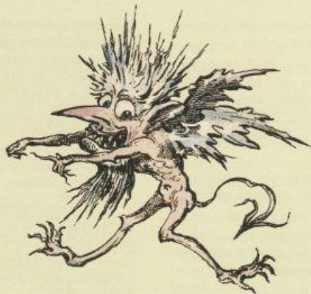
Русский мороз Russian Frost