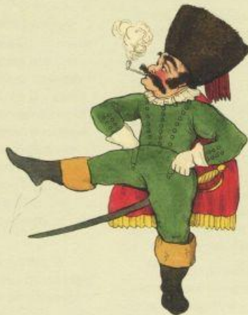
Русский посол Russian Ambassador