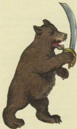
Русский медведь Russian Bear