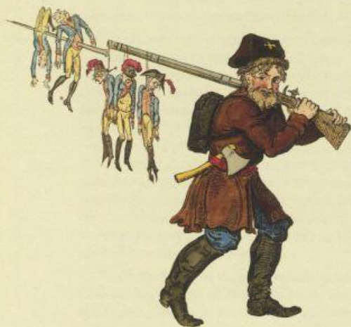
Русский мужик Russian Boor