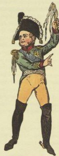
Александр I Russian Dandy