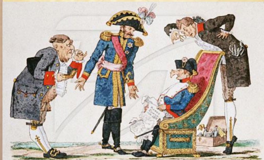
Нова привиденная Москва соборно имя Пророки и Маршалки И пока какой она представляла или Пророки или Маршалки или же Маршалки или же Пророки или же Маршалки или же Пророки или же Маршалки... Вспомните же, что в жизни Маршалки или же Пророки или же Маршалки или же Пророки или же Маршалки... Если вы увидите его в жизни, то увидите, что он не только Маршалки, но и Пророки, и Маршалки, и Пророки, и Маршалки... Это является выходом из заблуждений!