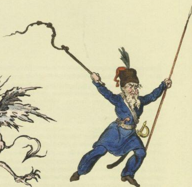
Русский казак Russian Cossack