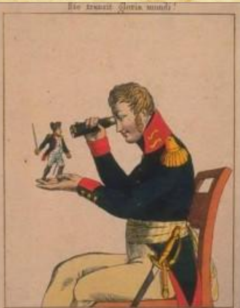
Wie nur nach England, kommt die Ehrenschleich große Name Doch auf den Flammn nach Paris Wie wunderbar es klar!