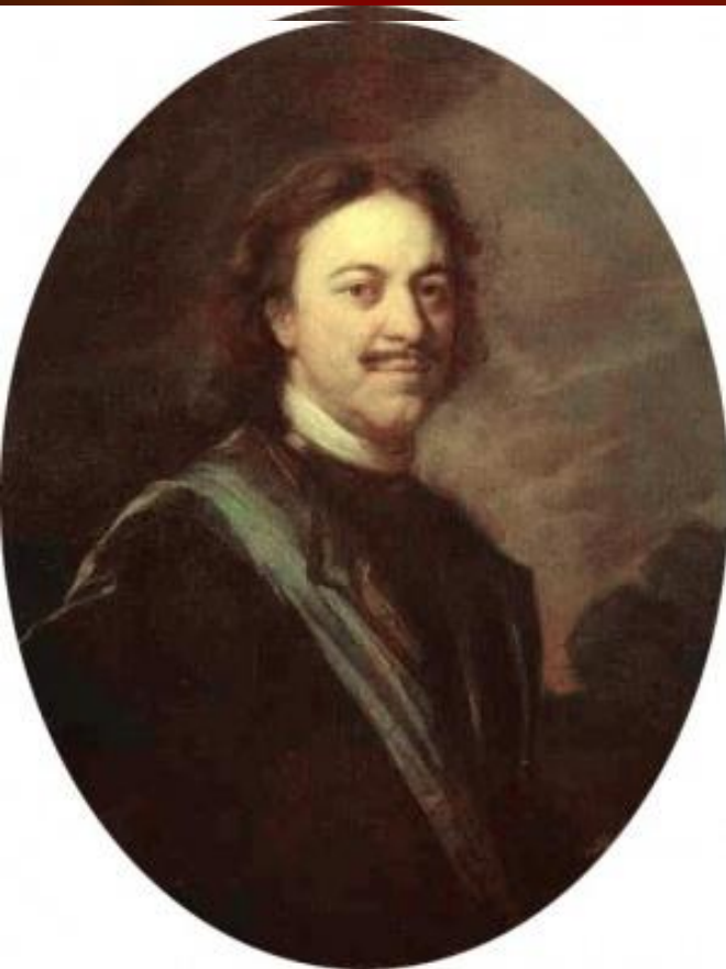
Портрет Петра I. 1724–1725 гг. Худ. А. Матвеев.

Петра не устраивала старая система государственного управления.