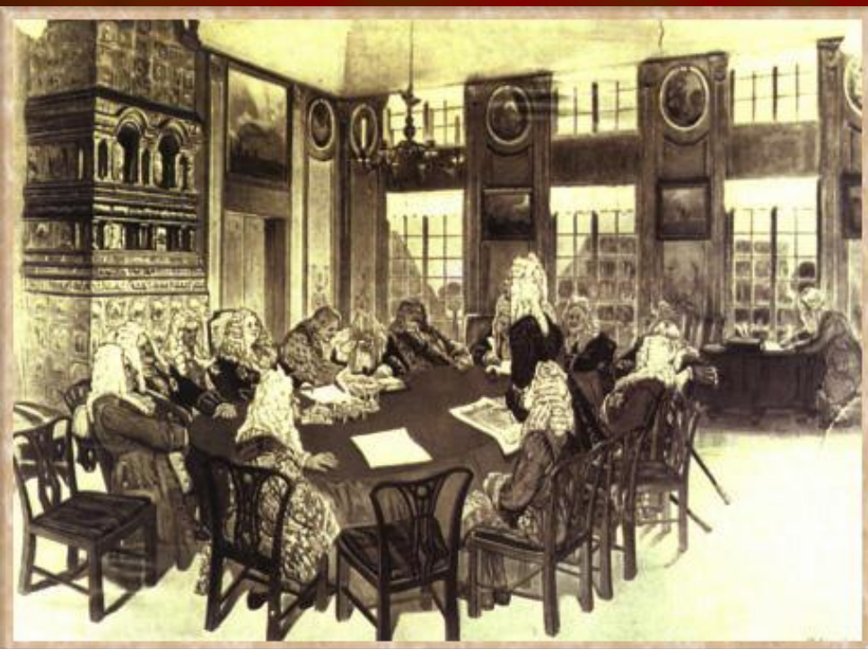
Заседание Сената при Петре I. Тушь, сепия, 1908. Худ. Д.Н. Кардовский.

Функции Сената: Контроль за министрами, назначение чиновников, высшая судебная инстанция, законосовещательный орган при царе.