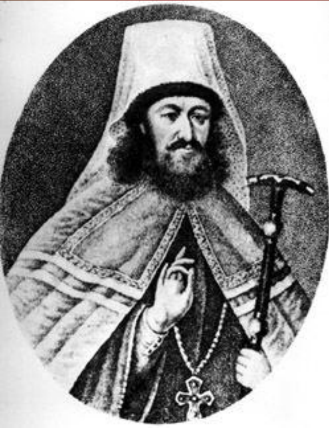
Митрополит Стефан Яворский (1658–1722).

После смерти патриарха Адриана в 1700 г. Пётр не разрешил избрать нового патриарха.