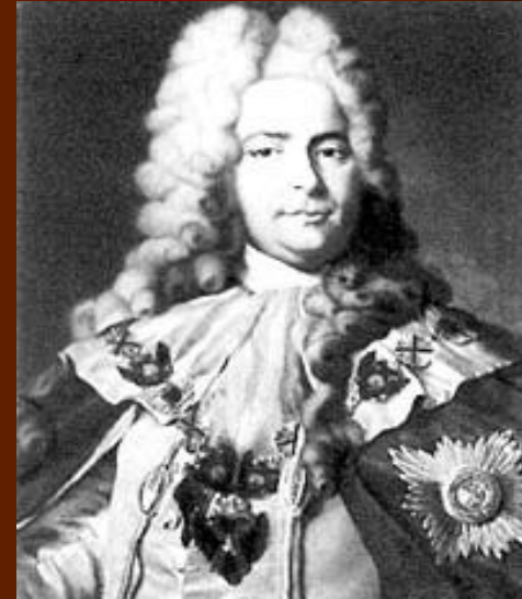
Ягужинский Павел Иванович (1683–1736)