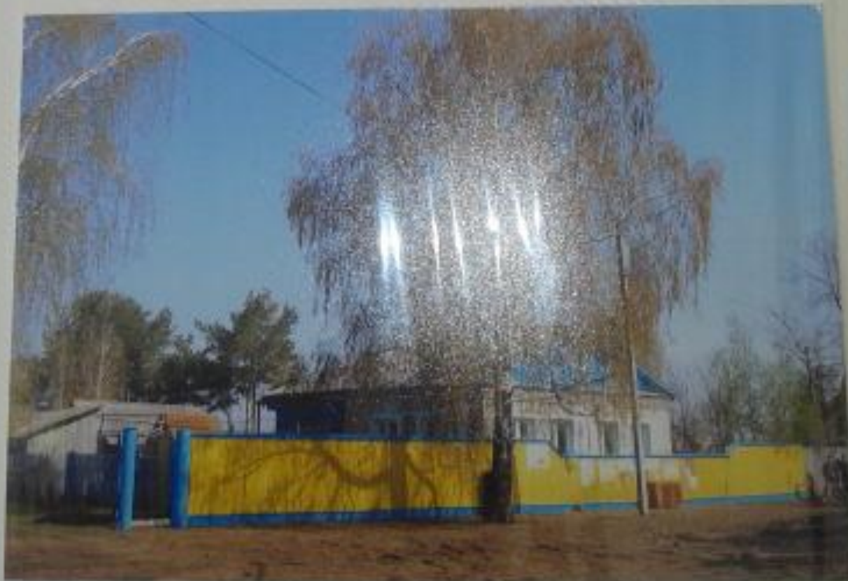
Улица Советская, дом № 6