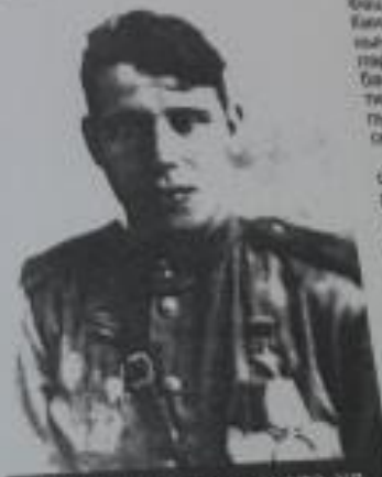
Сугуш кезиндеги үзгүлтүксүз уюшулган.