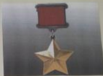
Май 1945 года. После вручения Золотой Звезды Героя