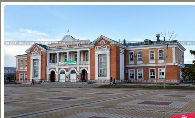
Дворец культуры. Город Усмань. Липецкая область. Россия