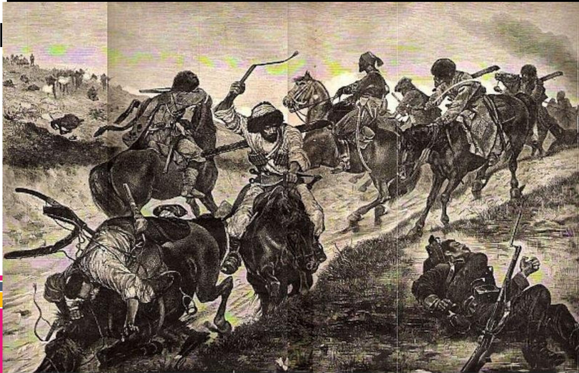
A skirmish on the road to Plevna - Circassian Cavalry in the foreground HARPERS'S WEEKLY, A JOURNAL OF CIVILIZATION New York, Saturday, December 1, 1877