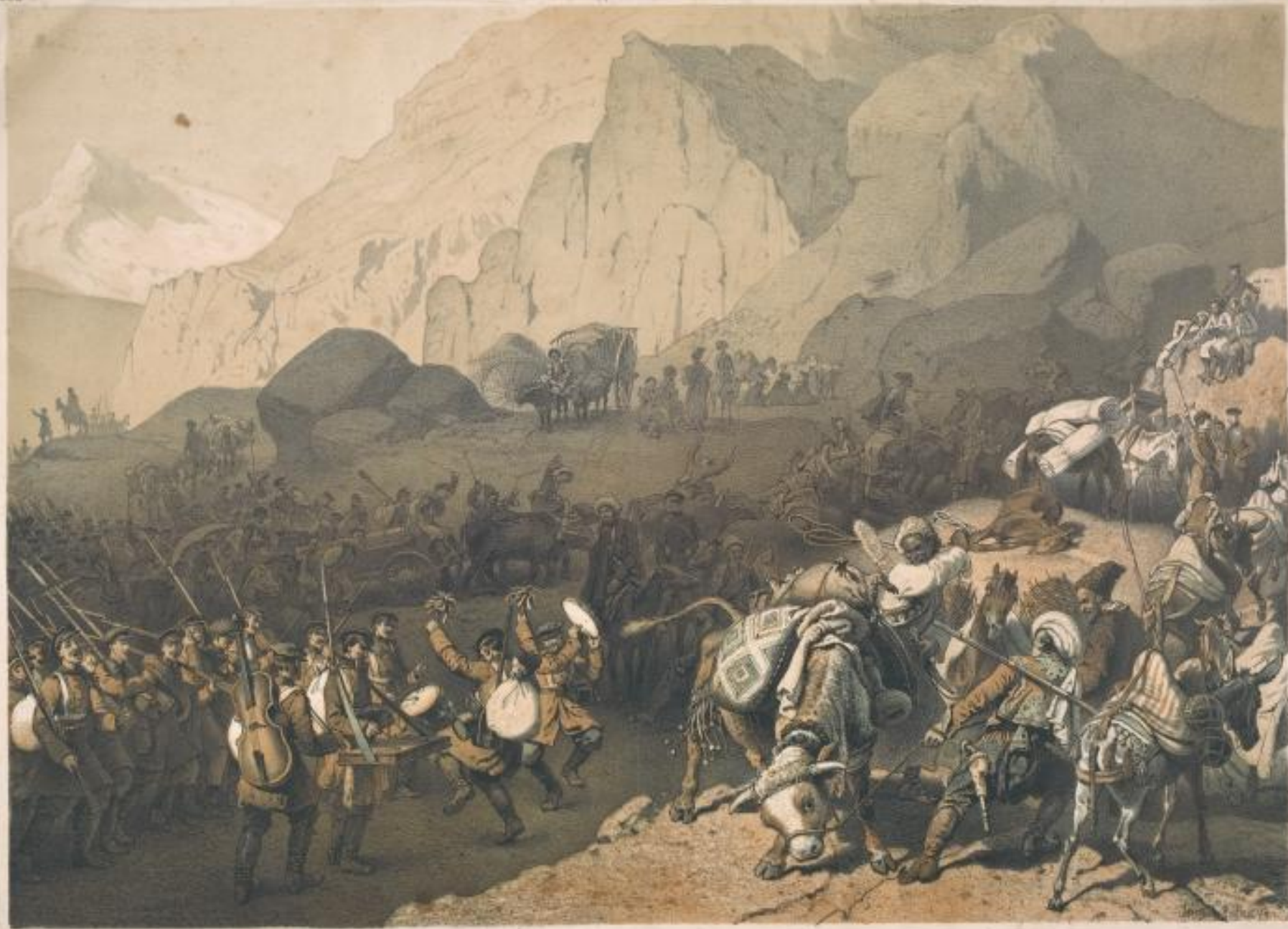
Подъем осадной артиллерии на Турчи-Лагз (из Августовъ). Воспоминание одамъ крѣп. Чола въ 1849 г. (Картина Академика В. В. Тимма).