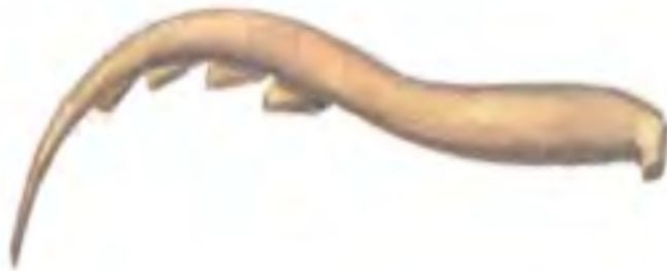
Серп из кости с каменными вкладышами.