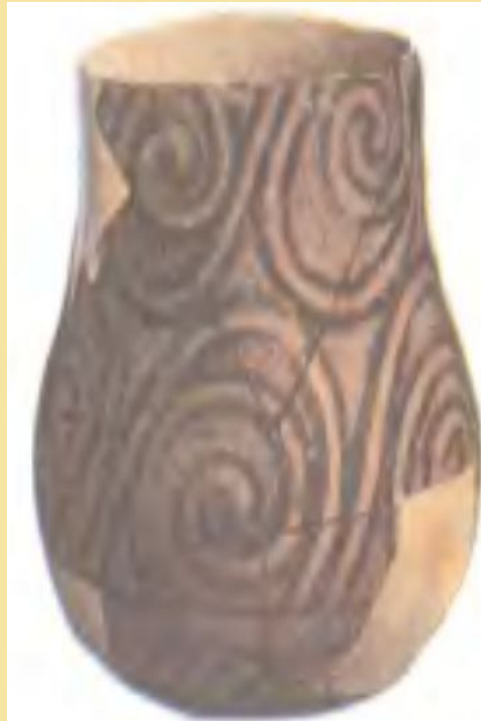
Глиняный сосуд с узорами.