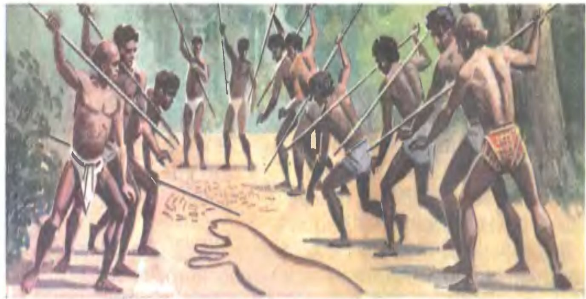
Колдовской обряд перед охотой. Рисунок нашего времени.