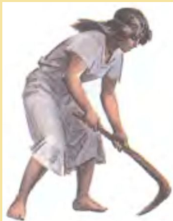
Женщина с мотыгой.