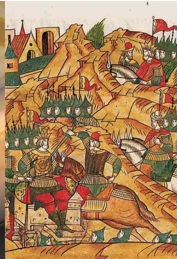
1389 г. – Битва на Косовом поле