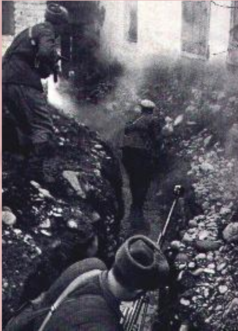
Бой за Моздок. Сентябрь 1942 г.

Начиная войну Гитлер рассчитывал, что СССР развалится как «карточный домик», но советский народ наоборот только сплотился.