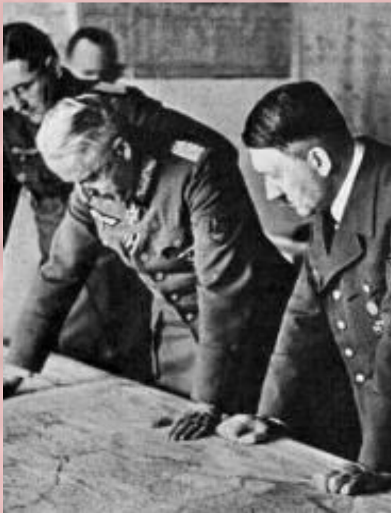
А.Гитлер и Э.Манштейн у карты.

Победа под Москвой породила у И.Сталина иллюзию о быстром разгроме немецких войск и он поставил задачу уже в 1942г. начать общее наступление. Сталин предполагал, что немцы весной –летом 1942 г. вновь начнут атаковать Москву. Германия в это время испытывала недостаток сырья и Гитлер решил наступать на Юге, а для дезинформации Сталина немцы провели операцию «Кремль».