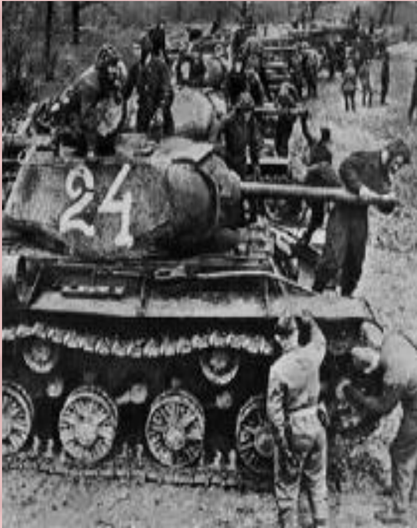
Советские танки перед Курской битвой

12 июля советские войска перешли в наступление. Под д.Прохоровка разгорелось крупнейшее в истории танковое сражение(1200 машин). Этот день стал переломным в ходе битвы. В течение месяца были освобождены Харьков, Орел, Белгород. Германия потеряла 500 тыс. солдат, 1500 танков, 3700 самолетов. В сентябре 1943 г. началась битва за Днепр, 6 ноября 1943 Красная Армия освободила Киев.