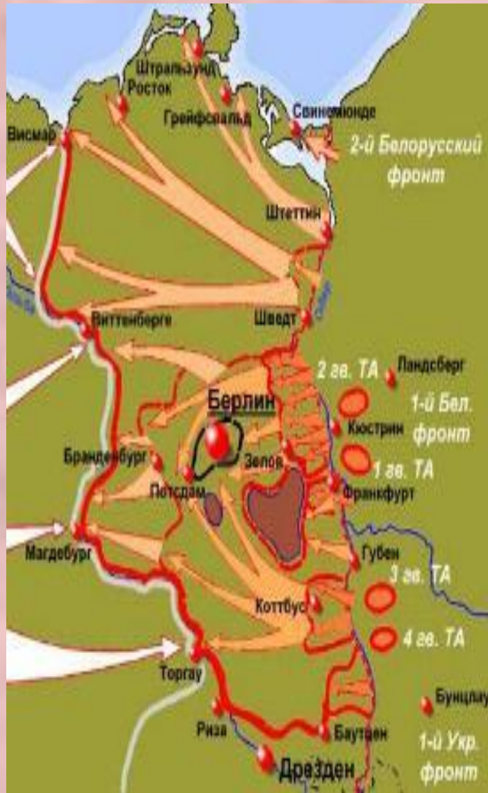
Битва за Берлин

24 апреля кольцо вокруг Берлина сомкнулось. Гитлер решил снять войска с Западного фронта. В результате этого американцы стремительно двинулись вперед и 25 апреля на Эльбе встретились с армией маршала И.Конева. 30 апреля на Рейхстагом взвилось Красное Знамя. 2 мая Берлин пал. 8 мая в присутствии Г.Жукова фельдмаршал Кейтель подписал капитуляцию. 9 мая капитулировала группировка в Праге. Этот день стал Днем Победы.