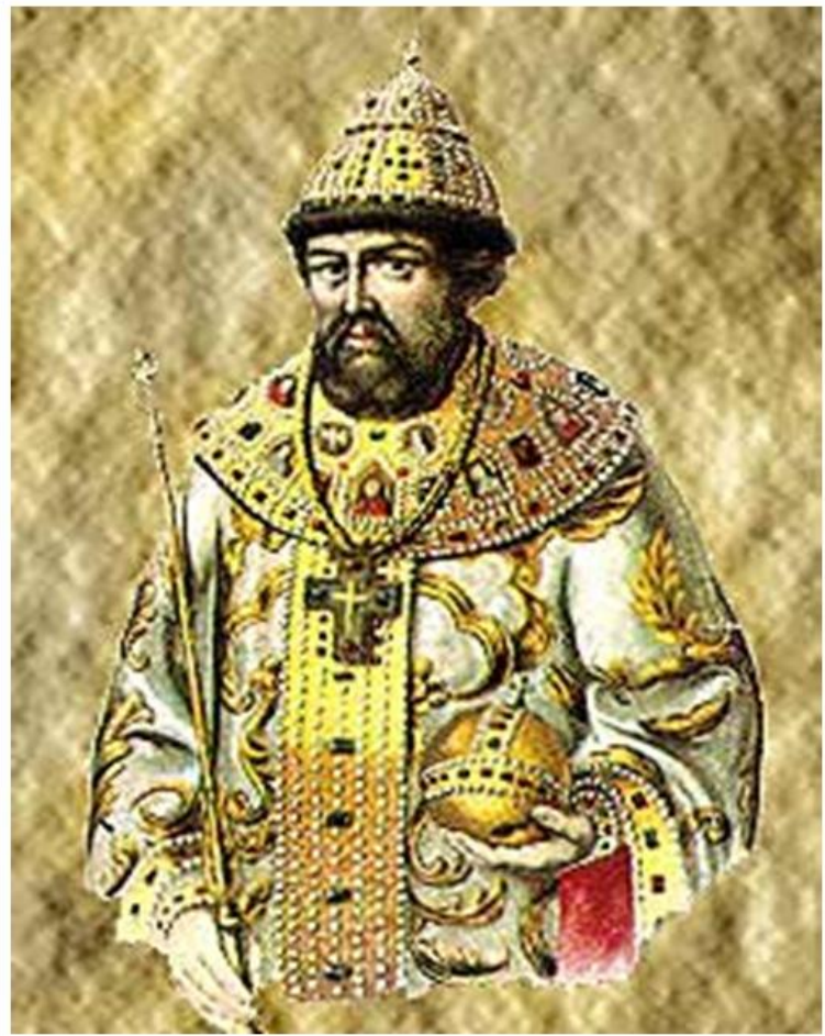
Царь Алексей Михайлович

Русский царь (с 1645 года), из династии Романовых. Занял трон после смерти отца Михаила Федоровича. Прославился «тишайшим» царем в 17 веке.