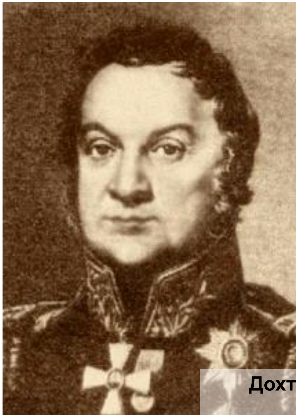
Дохтуров Дмитрий Сергеевич