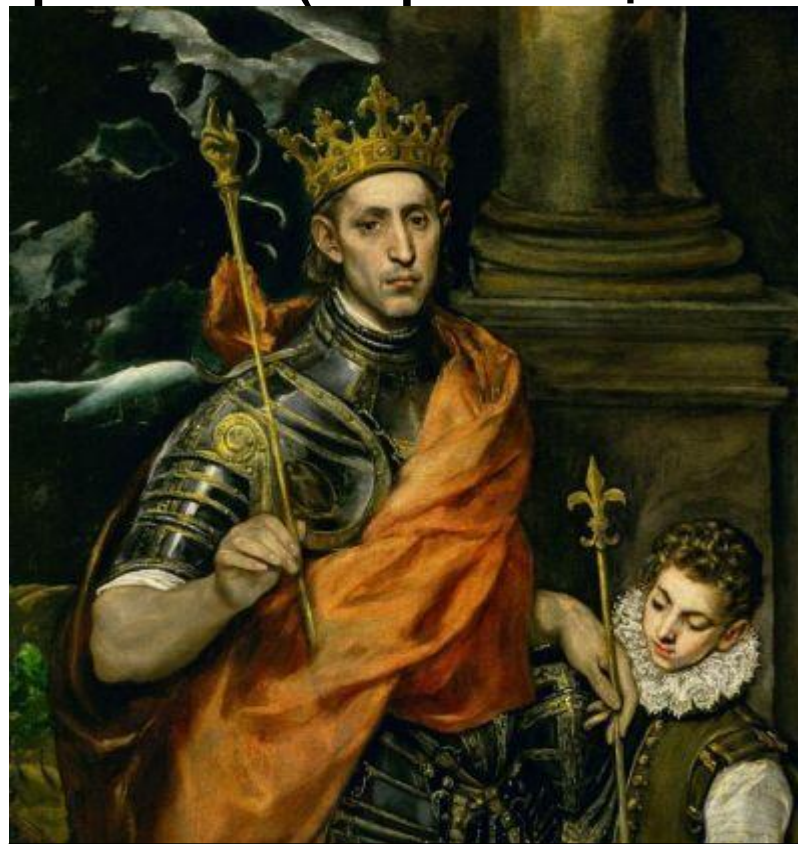
Людовик IX Святой