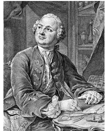
Михаил Ломоносов (1711-1756)

Варяги – это балты или западные славяне, которые пришли править в уже существовавшее государство