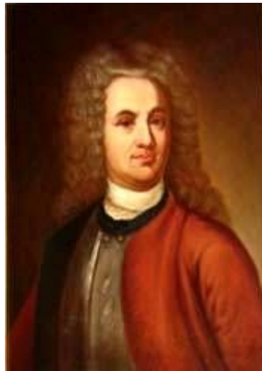
Герард Миллер (1705-1783)

Варяги – это норманы, которые создали русское государство