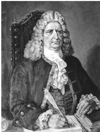
Готлиб Байер (1694-1738)

Варяги – это норманы, которые создали русское государство