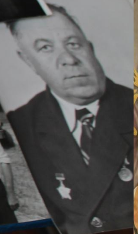
Первый смот бригады победы с 781039 704. 200