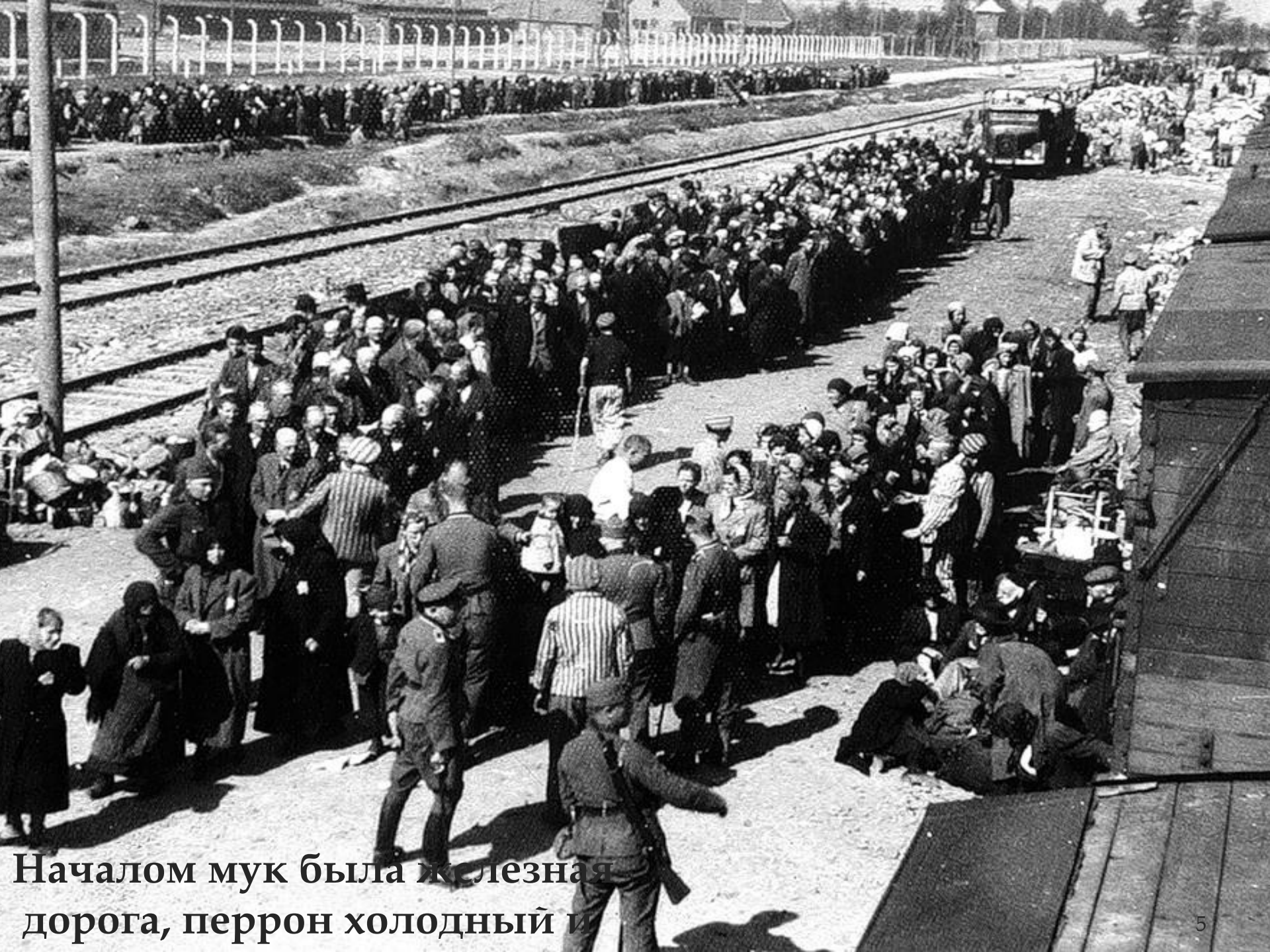
Началом мук была железная дорога, перрон холодный и