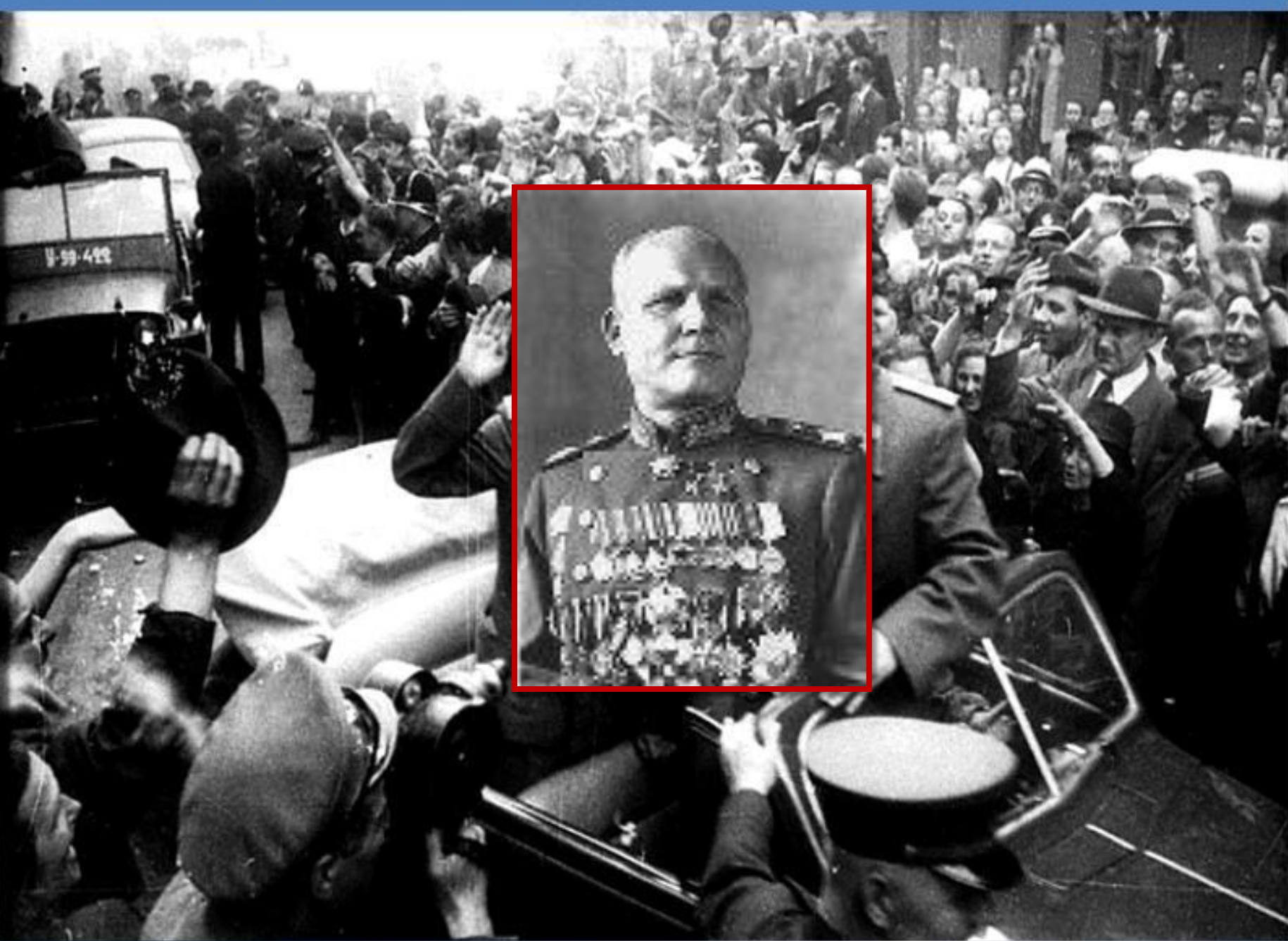
Войск Красной Армии и Конева