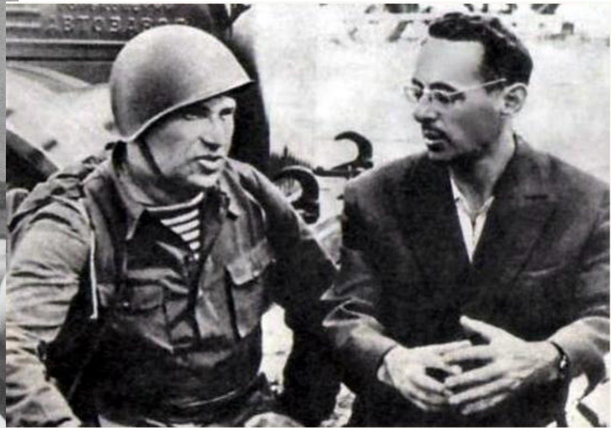
Марк Бернес (слева) и Юрий Левитан на съемках фильма «Два бойца»