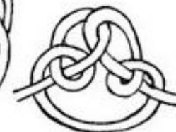
е) Огонь сварожичь