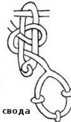
и) Три небесных свода