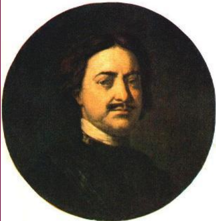
И. Никитин Портрет Петра I.

В н.18 в. художественная культура приобрела светский характер и получила поддержку государства.