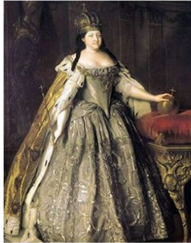
АННА ИОАННОВНА II