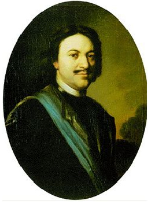
ПЕТР I АЛЕКСЕЕВИЧ