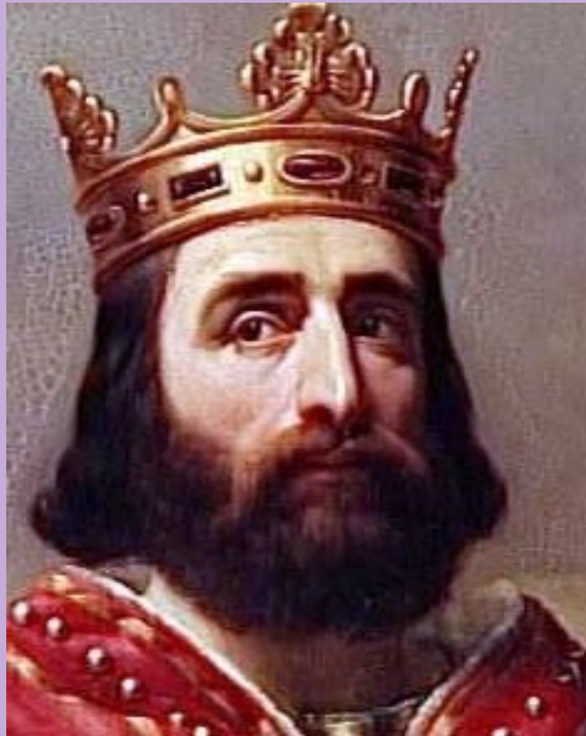
ПИПИН КОРОТКИЙ 741 - 768 г. правления