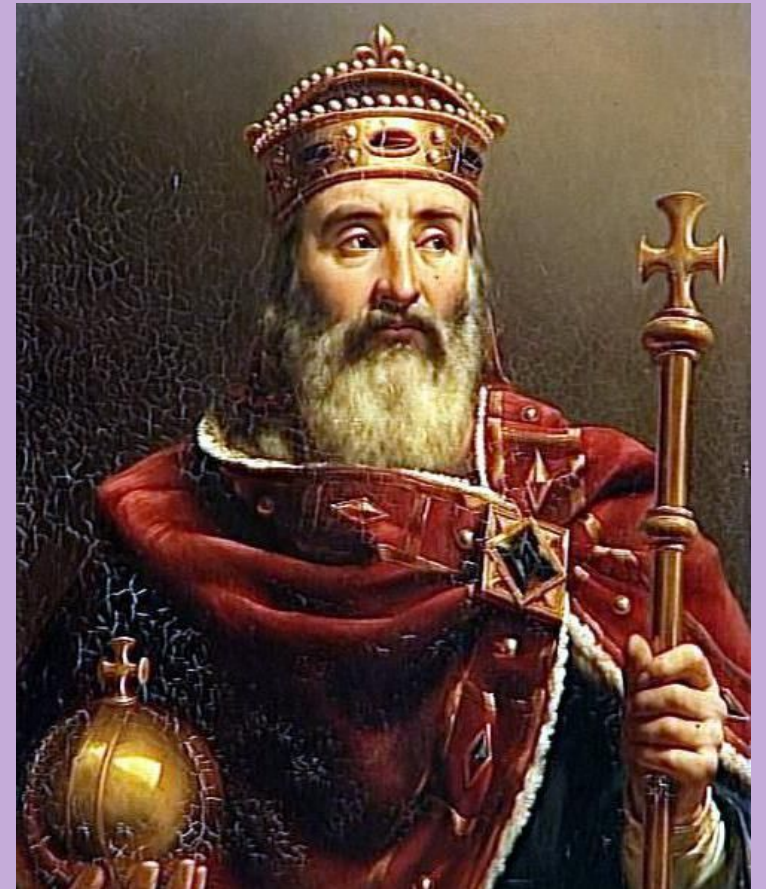
КАРЛ ВЕЛИКИЙ 768–814 г. правления