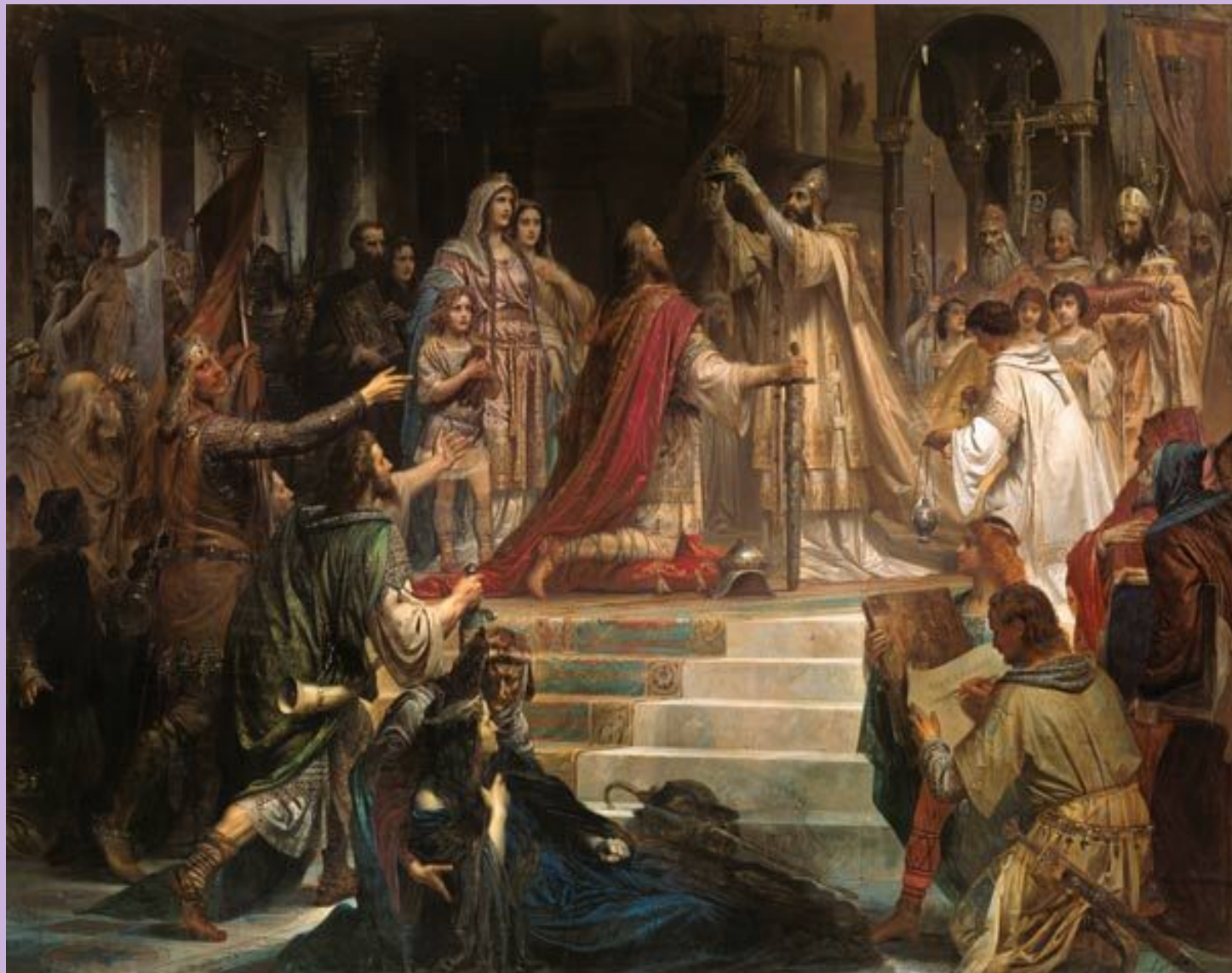
800 г. Рим. Собор Св. Петра. Коронация Карла Великого папой римским Львом III