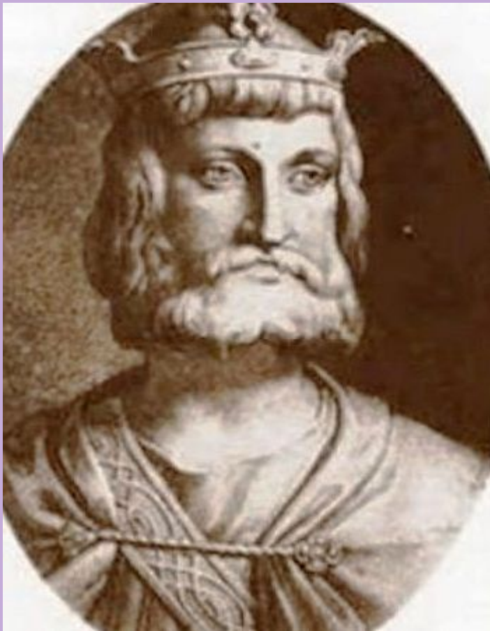
КАРЛ МАРТЕЛЛ 717-741 г. правления