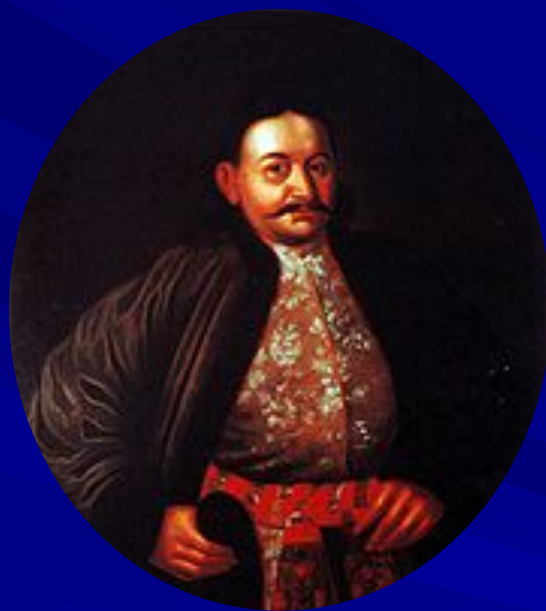
Фёдор Юрьевич Ромодановский, князь, русский государственный деятель, генералиссимус