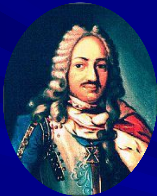
Франц Лефорт, русский государственный и военный деятель, генерал и генерал- адмирал