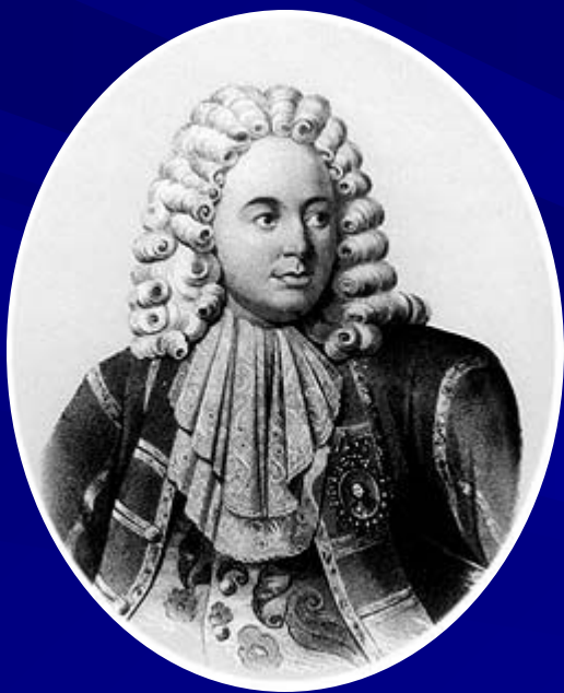
Патрик Гордон, русский военный деятель, генерал и контр-адмирал (по происхождению шотландец)