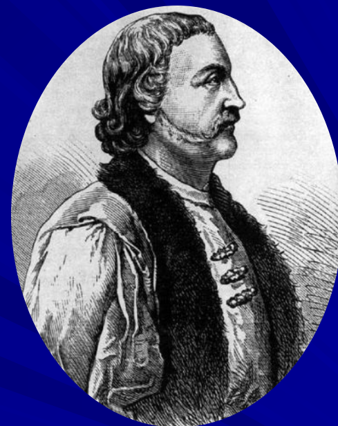
Борис Алексеевич Голицын, князь, боярин, руководитель приказа Казанского дворца, воспитатель юного Петра.