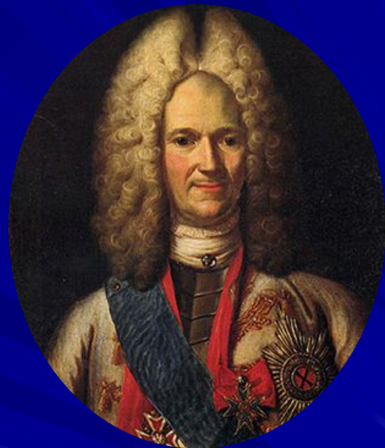
Александр Данилович Меншиков, русский государственный и военный деятель, светлейший князь Российской и Священной Римской империи, генералиссимус