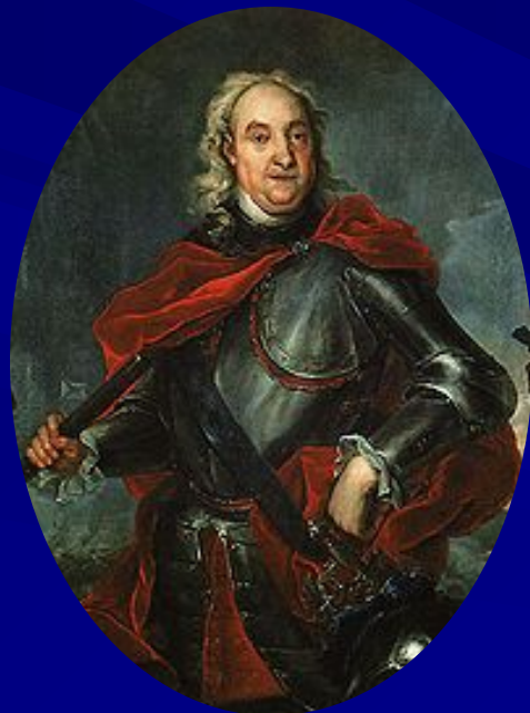
Фёдор Матвеевич Апраксин, русский государственный деятель, граф, генерал-адмирал