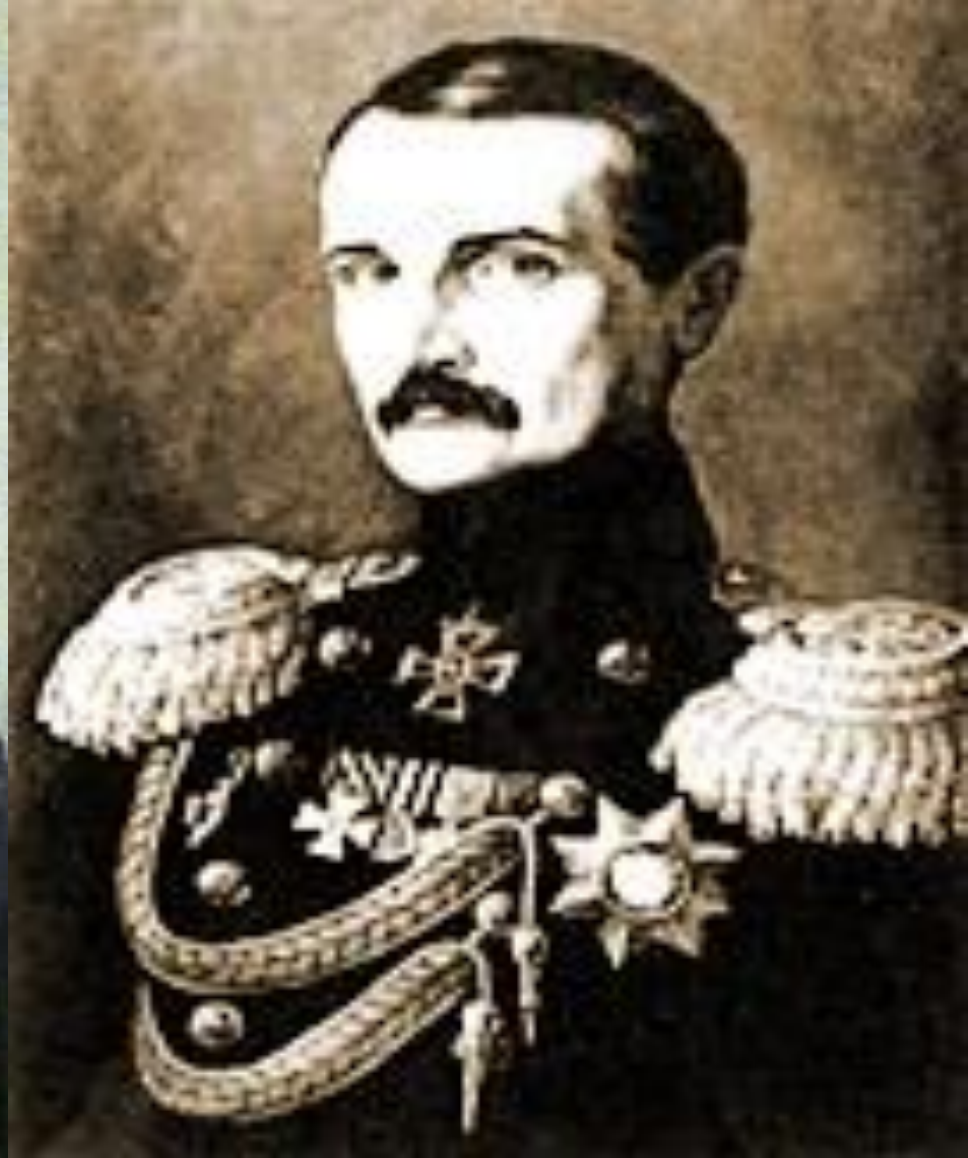
П. С. Нахимов