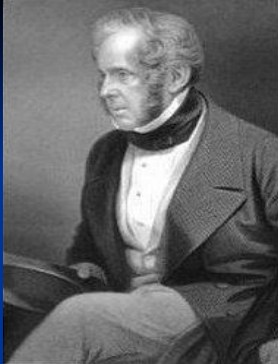
Виконт Пальмерстон – премьер-министр Англии