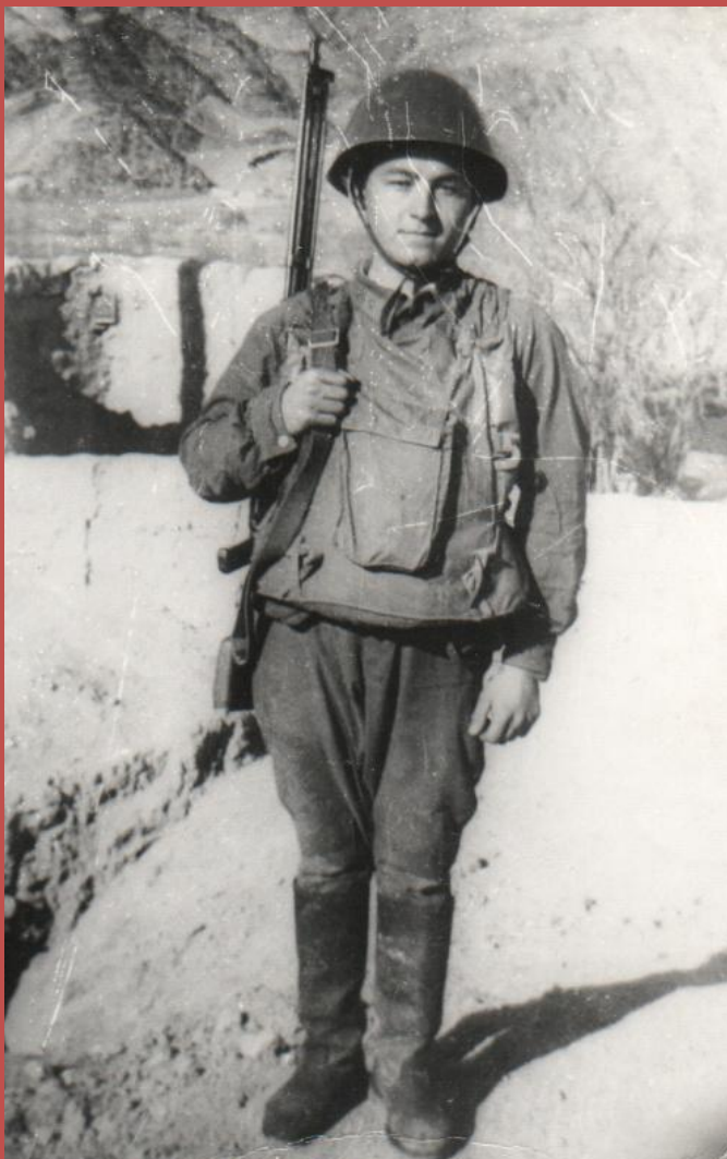
Март 1987 года. На перевале Саланг.