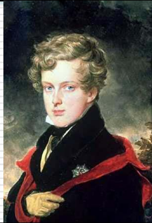
Наполеон II – сын Бонапарта

В 1810 г. Наполеон женится на дочери австрийского императора Марии –Луизе, подарившая ему наследника, который умер молодым.