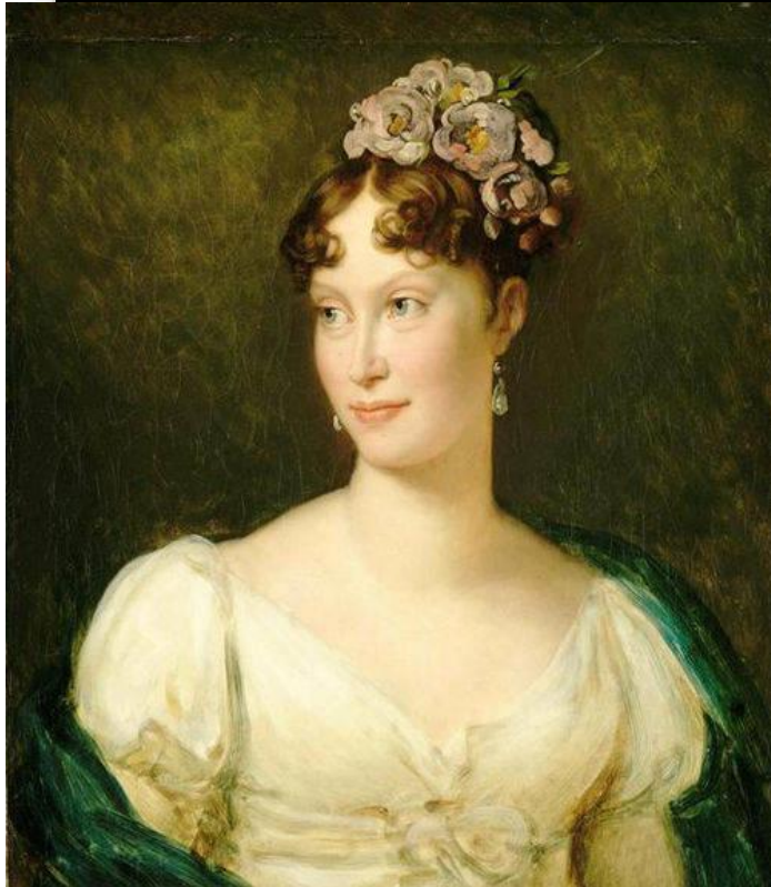
Мария – Луиза Австрийская