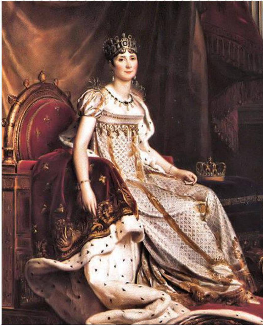
Жозефина, первая жена Наполеона

В распоряжении Наполеона было три королевских дворца, к национальным французским праздникам прибавился ещё один – день рождения императора, к его жене, Жозефине, обращались « мадам »