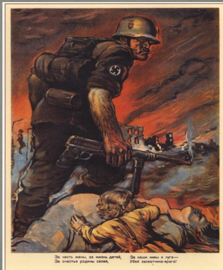
294. Голованов Л. За честь жены, за жизнь детей, <...> убей захватчика-врага! 1942