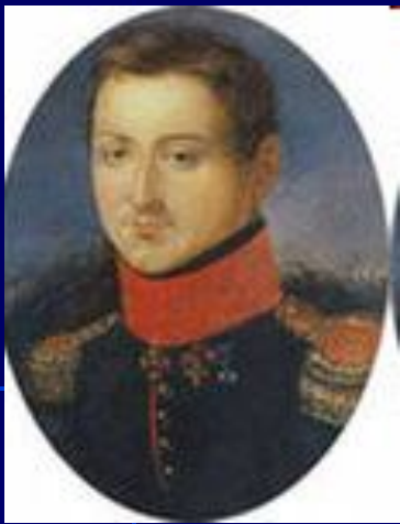
С.И. Муравьев-Апостол. Пестель П.И.