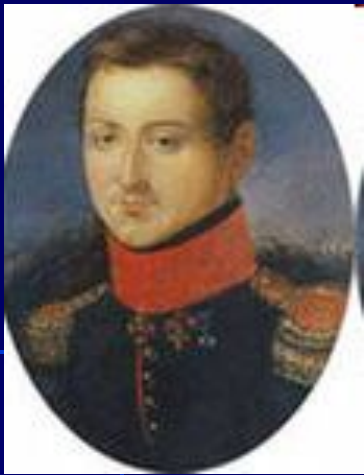
С.И. Муравьев-Апостол. Пестель П.И.