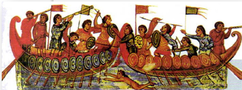
Морское сражение. Византийская миниатюра. VI—VII вв.