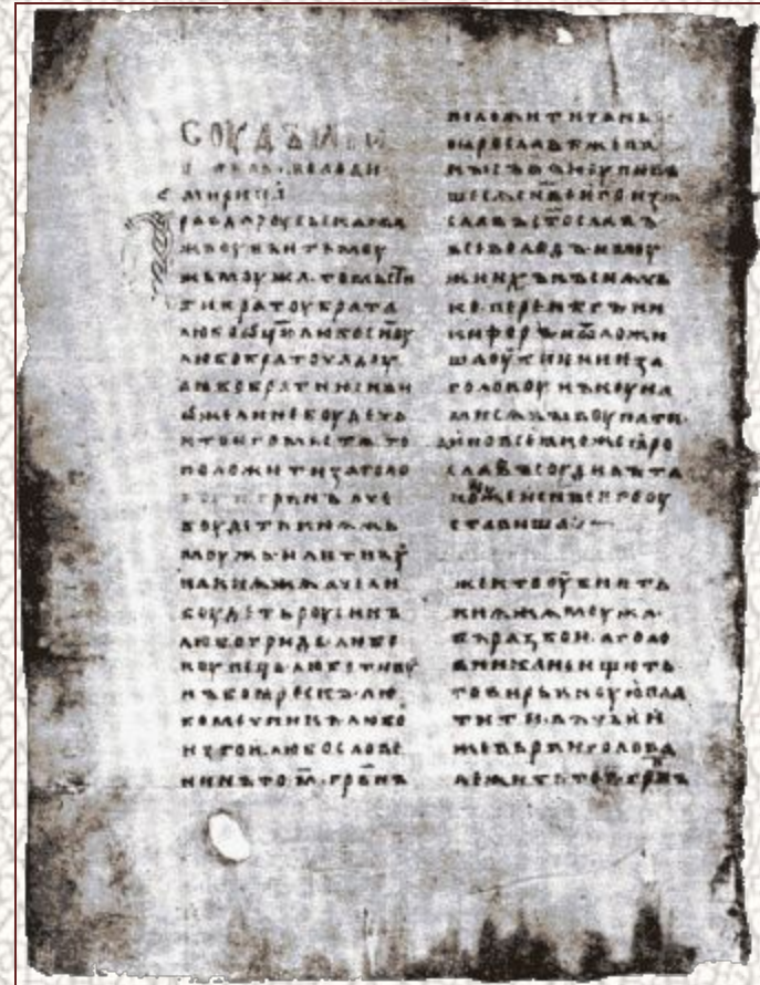
Синоидальный список Русской Правды, 1282.

При великом князе Ярославе Мудром Русь получила первый свод законов. Он известен под названием «Русская Правда».