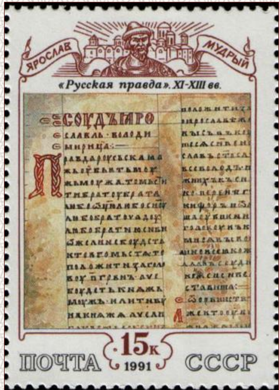
Марка "Русская правда" (XI-XIII вв)