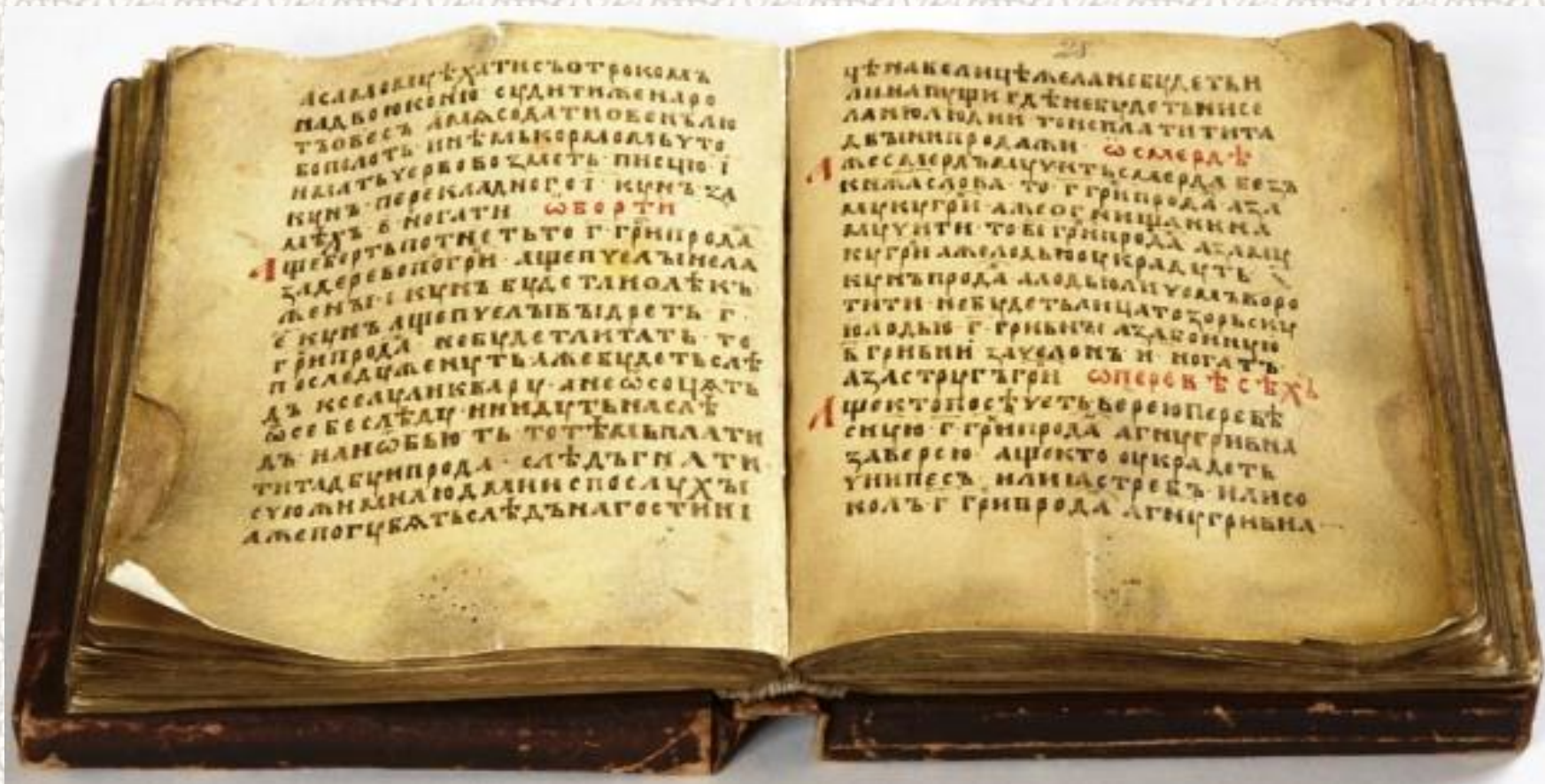
Русская правда. XV век.

Этот выдающийся памятник древнерусского права сохранился в трех видах или редакциях (краткая, пространная и сокращенная) и многочисленных списках, потому что с течением времени законодательство изменялось и дополнялось.