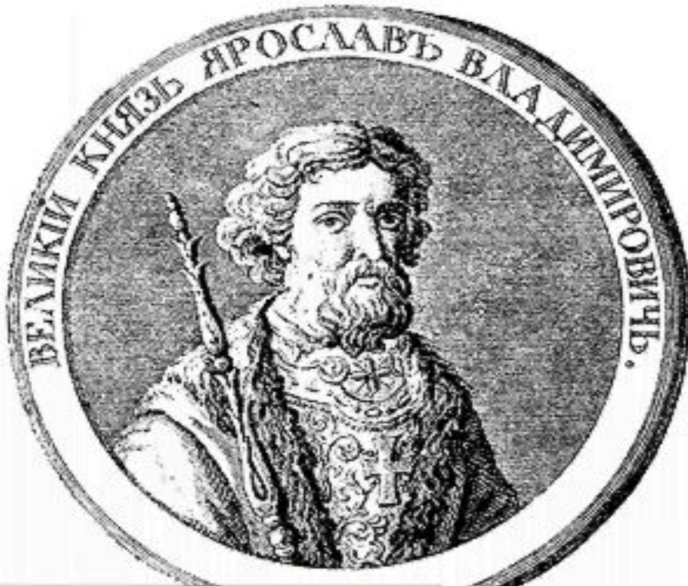
Ярослав Мудрый (1019-1054 гг.)