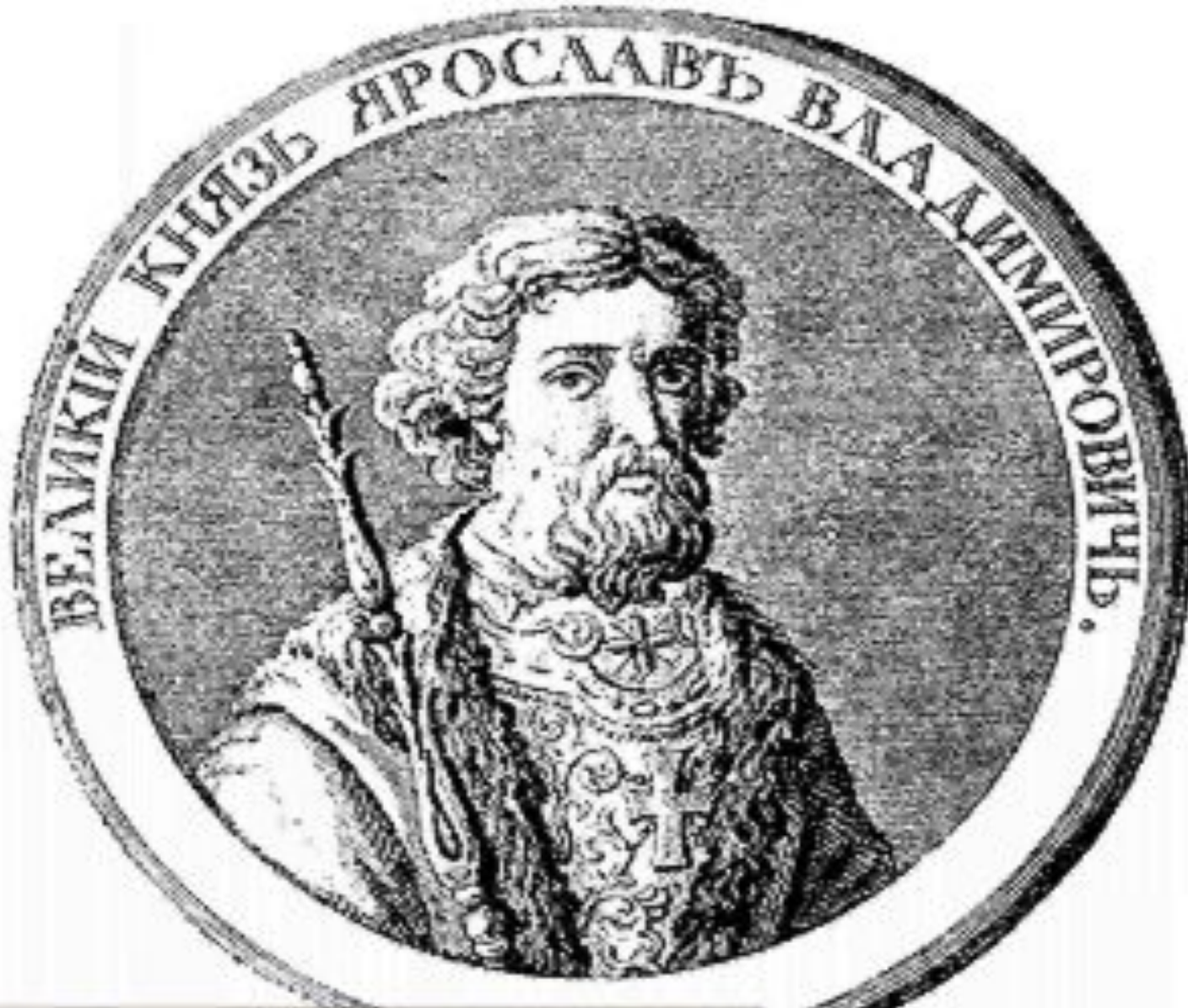
Ярослав Мудрый (1019-1054 гг.)