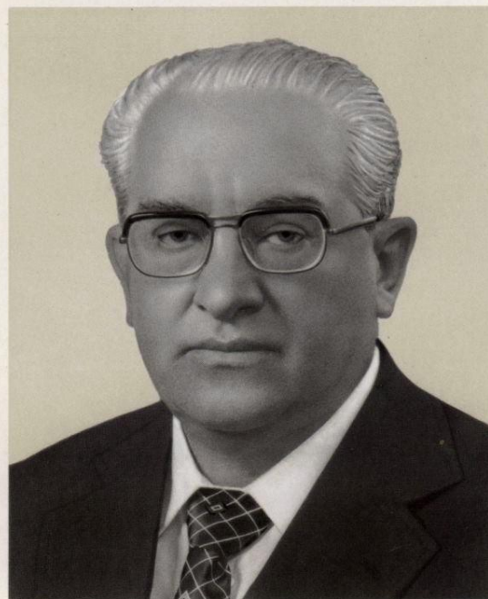
Юрий Владимирович АНДРОПОВ

В феврале 1984 года умирает Андропов, и главой КПСС, а затем и государства стаёт Константин Устинович Черненко ( 13 февраля 1984-10 марта 1985 ), продолживший курс, начатый Андроповым. При нём окончательно сформировалось и усилило свои позиции крыло руководства партии, лидером члена Политбюро стал М.С. Горбачёв. 10 марта 1985 года Черненко умер. Менее чем через сутки пленум ЦК КПСС избрал генеральным секретарём ЦК КПСС Горбачёв