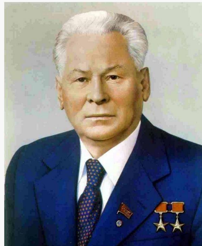
Константин Устинович Черненко С 1931 по 1933 гг. служил в Казахстане на погранзаставе