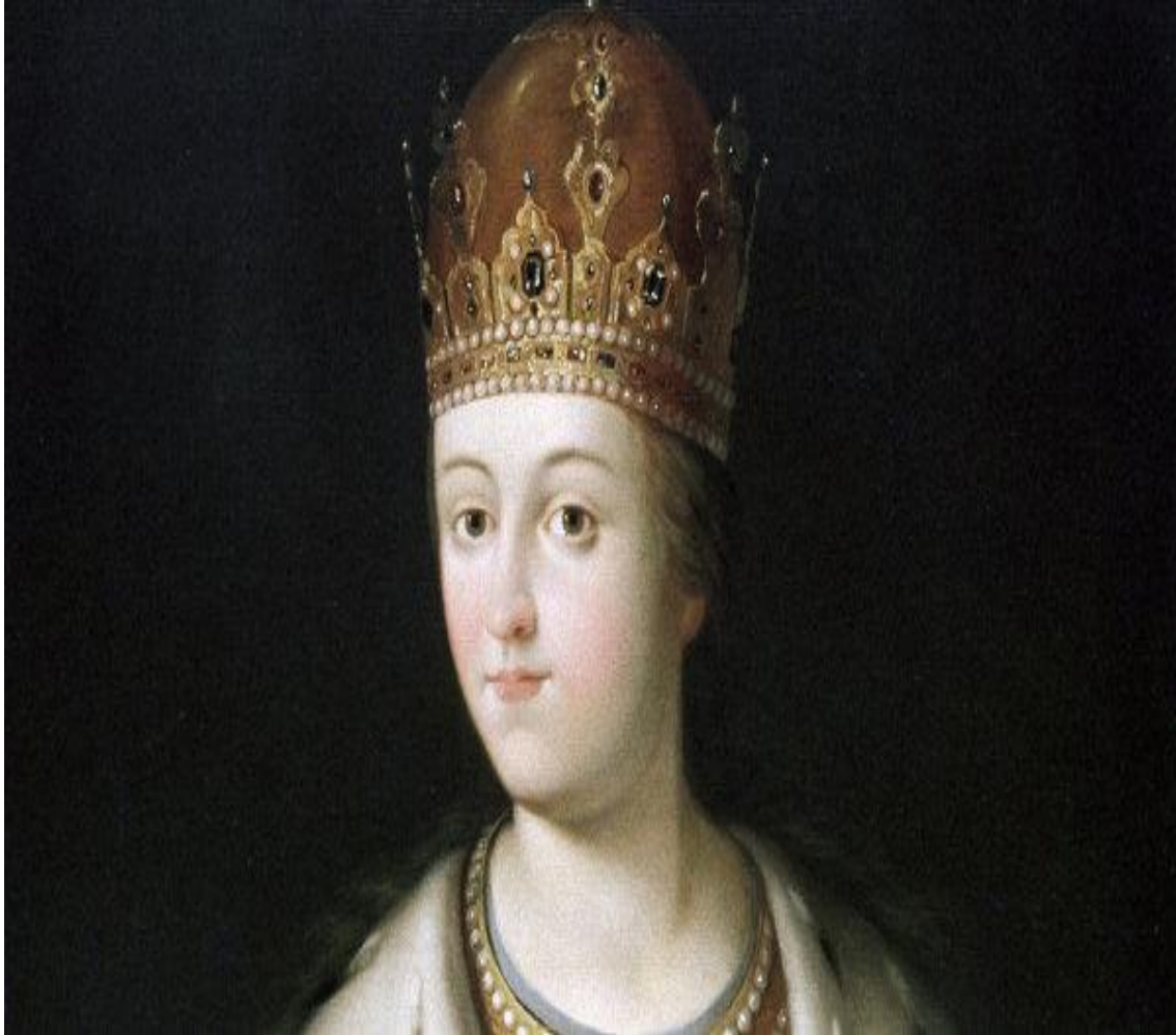
Софья Алексеевна 1682-1688гг.