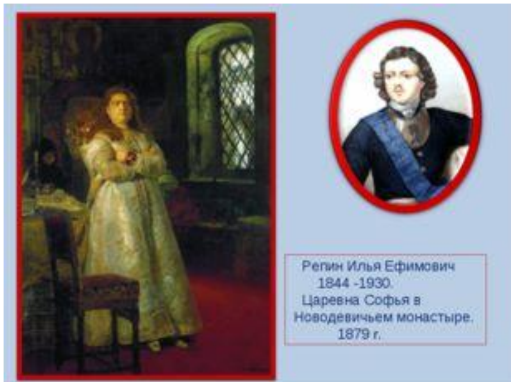
Регин Илья Ефимович 1844 -1930. Царевна Софья в Новодевичьем монастыре. 1879 г.