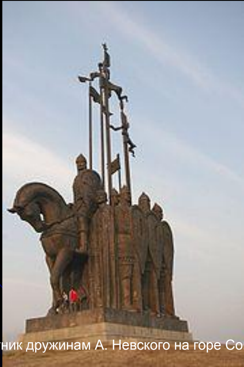
Памятник дружинам А. Невского на горе Соколик