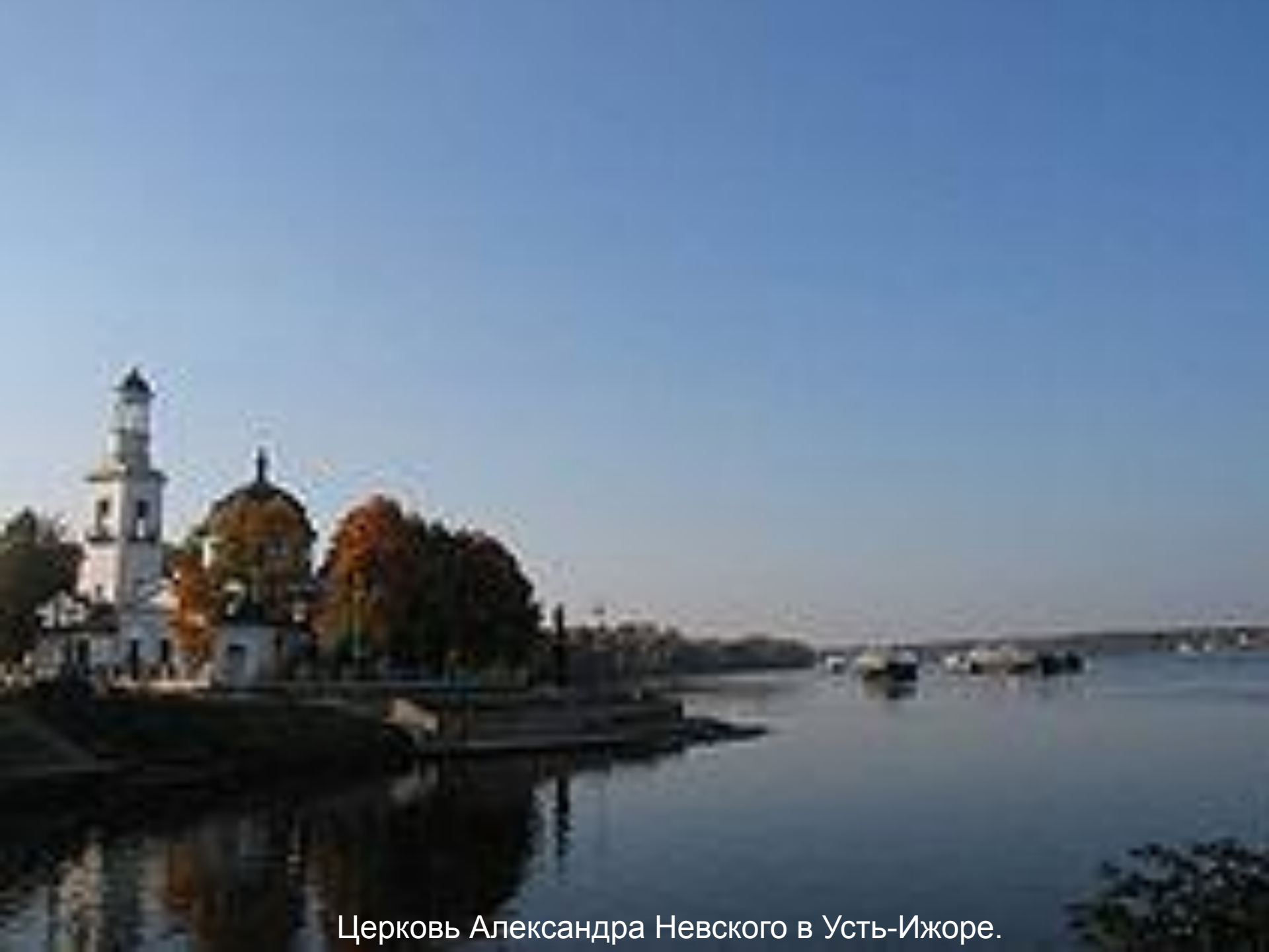
Церковь Александра Невского в Усть-Ижоре.