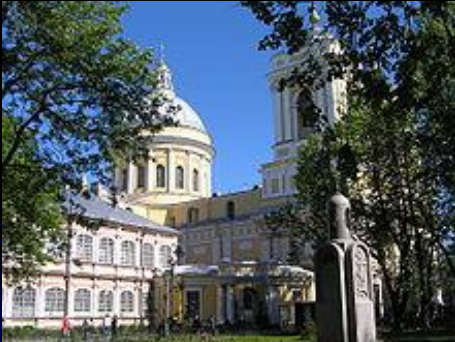
Церковь Александра Невского в Александро-Невской лавре