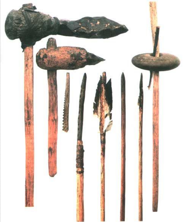
Орудия труда древних людей