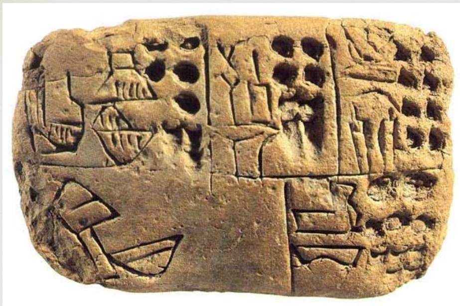
Надписи на камне и глине