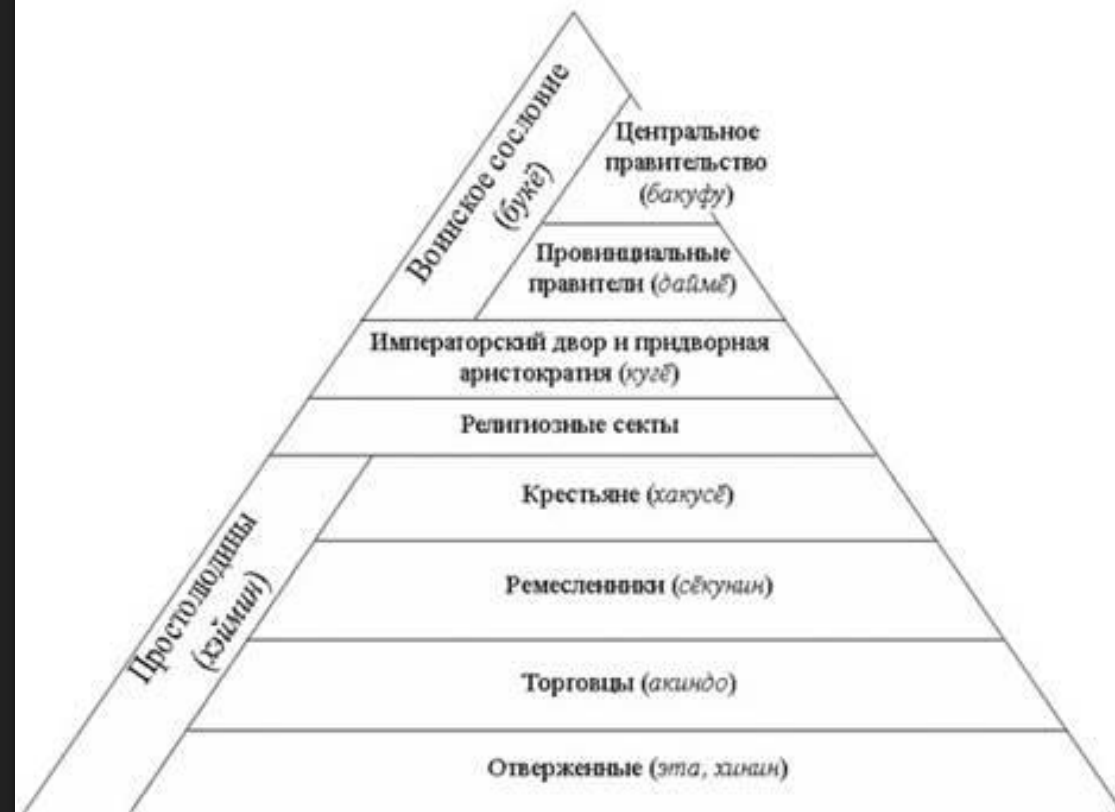
Классовая структура общества Токугава

Токугава Иэясу (1542—1616) Токугава Хидэтада (1579—1632) Токугава Иэмицу (1604—1651) Токугава Иэцуна (1641—1680) Токугава Цунаёси (1646—1709) Токугава Иэнобу (1662—1712) Токугава Иэцугу (1709—1716) Токугава Ёсимунэ (1684—1751) Токугава Иэсигэ (1711—1761) Токугава Иэхару (1737—1786) Токугава Иэнари (1773—1841) Токугава Иэёси (1793—1853) Токугава Иэсада (1824—1858) Токугава Иэмоти (1846—1866) Токугава Ёсинобу (1837—1913)