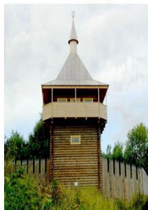
Памятник археологии «Усть - Шексна»

Однако во время татаро-монгольского нашествия оно было сожжено, а впоследствии и вовсе исчезло. В летописи от 1137 года говорится, что возрожденное на правом берегу Волги поселение стал носить имя Рыбаньск.