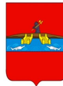
Герб 1778 года

После того как в том же, 1777 году, Рыбной слободе был присвоен статус города, город стал называться Рыбинск.