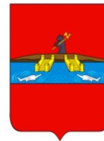
Герб 1778 года

После того как в том же, 1777 году, Рыбной слободе был присвоен статус города, город стал называться Рыбинск.