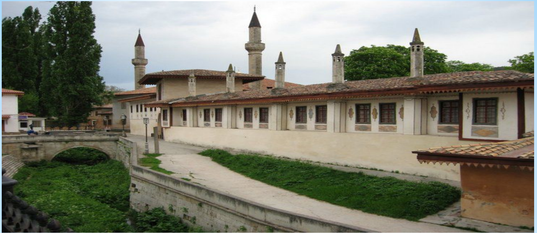
Дворец крымских ханов в Бахчисарае (XVI – XVIII в.)