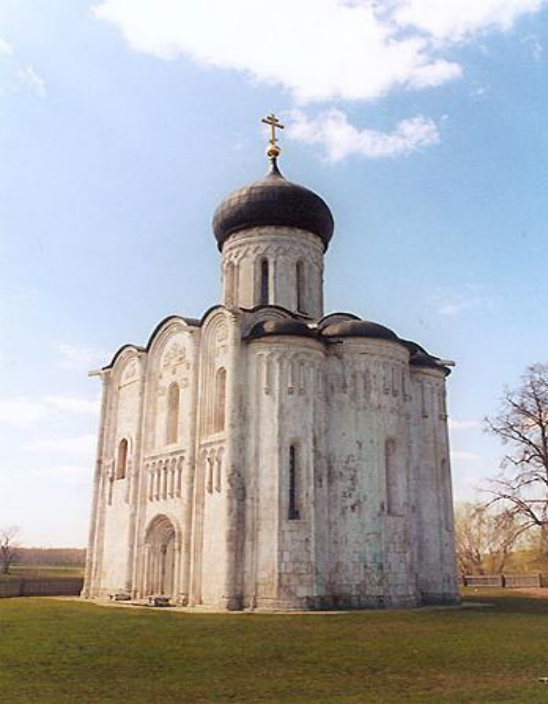
Церковь Покрова на р. Нерль