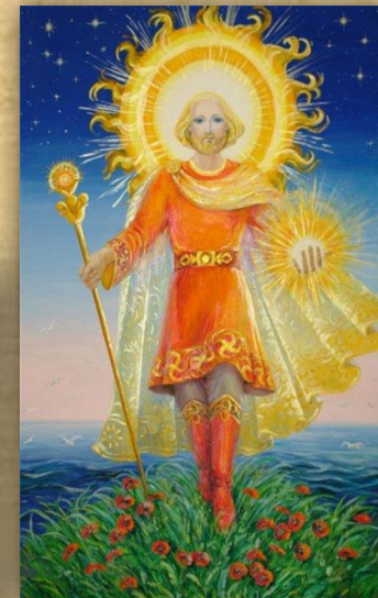
Ярило бог солнца