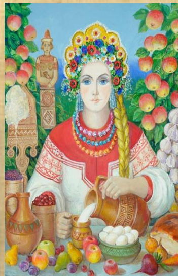
Мокошь божество плодородия