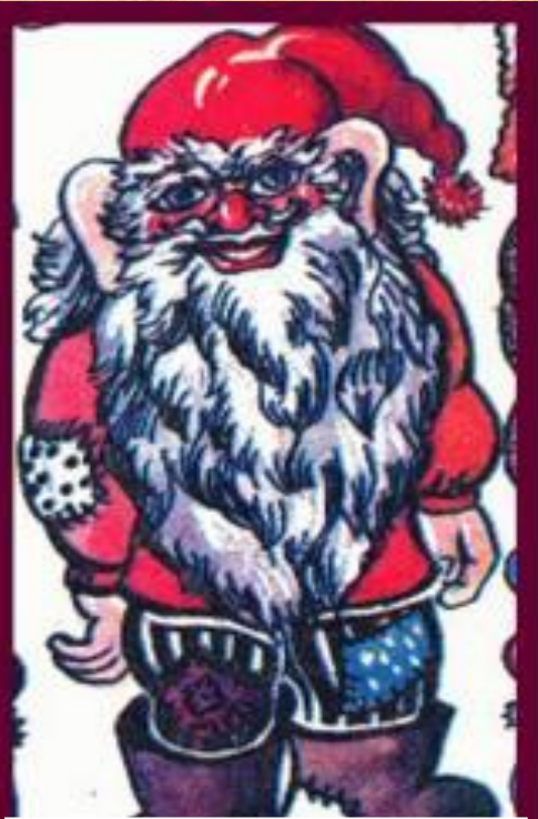
Домовой – дух дома