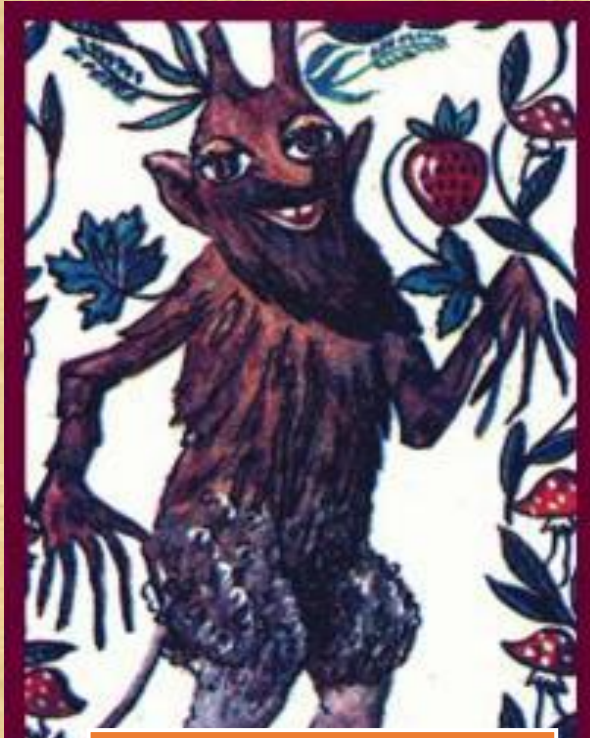
Леший – дух леса