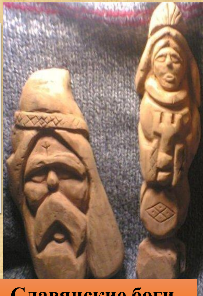
Славянские боги Сварог и Мокошь

Идол – деревянная или каменная статуя, изображение бога