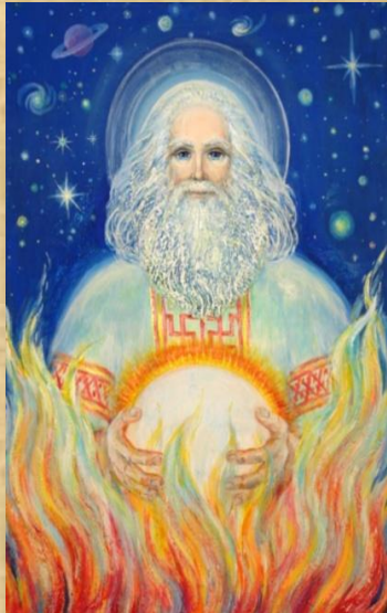
Сварог бог вселенной

Язычество – вера в существование многих богов и духов (многобожие-политеизм)