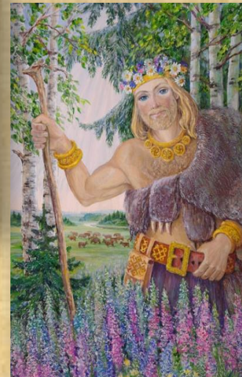
Велес покровитель скотоводства