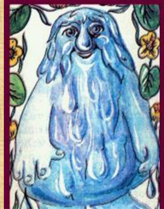
Водяной – дух рек, озер, болот

Нечистая сила - «низшие духи» делились на полезных и опасных.