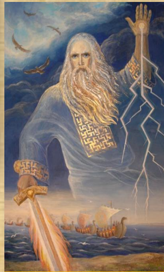
Перун бог грома и молний