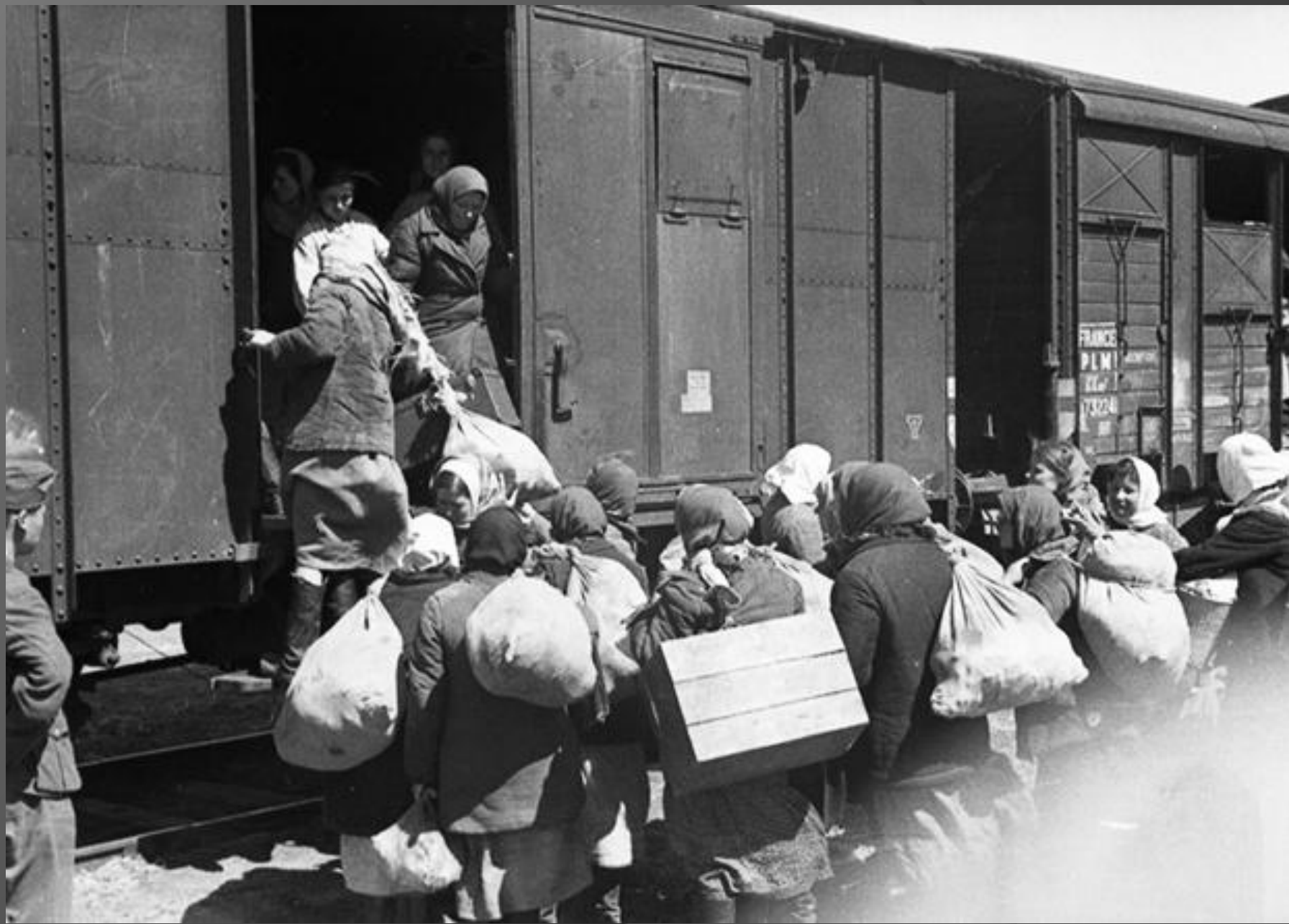
Депортированных перевозили в товарных вагонах