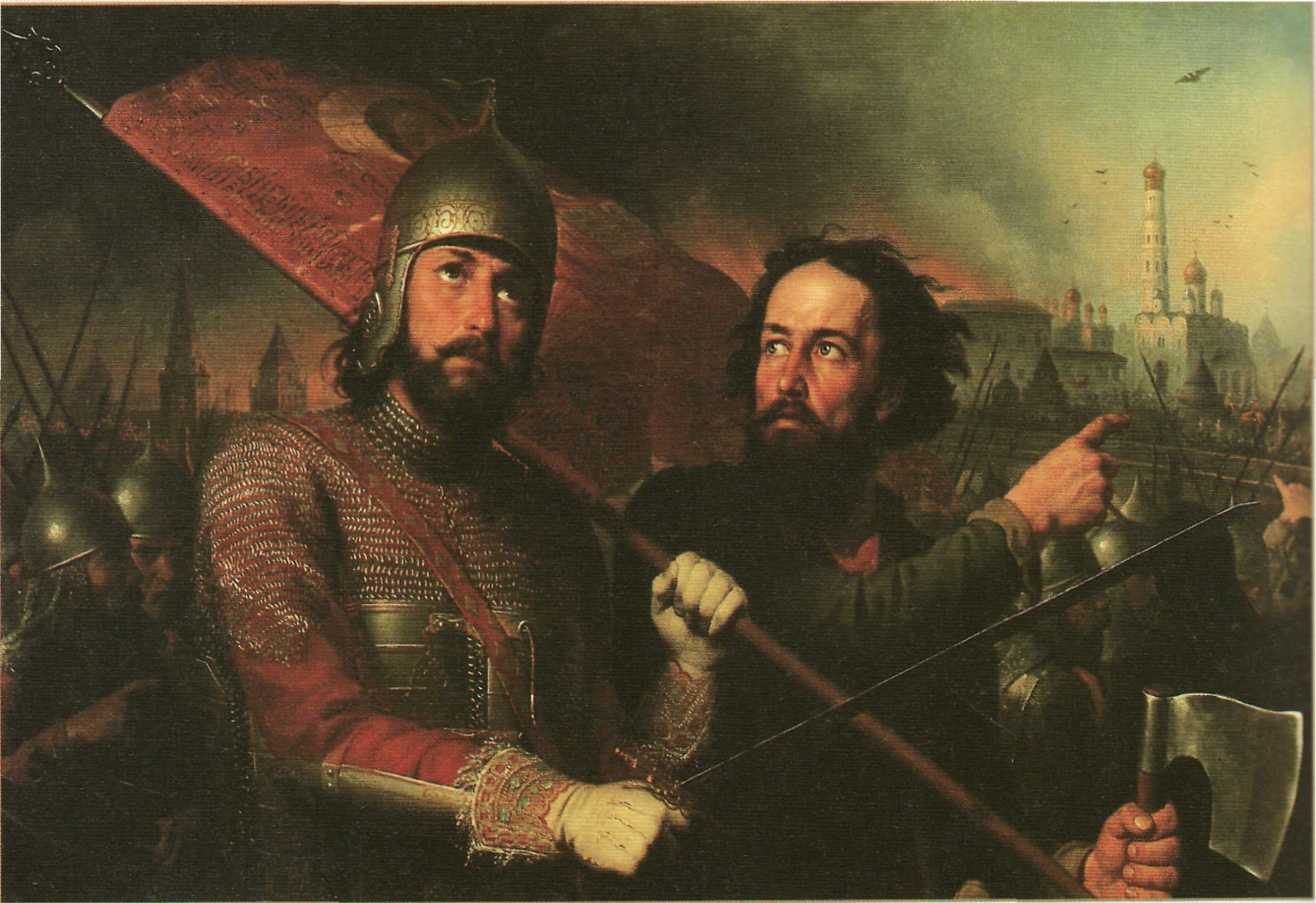
М. Скотти. Минин и Пожарский